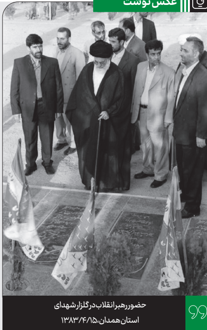
حضور رهبر انقلاب در گلزار شهدای استان همدان، ۱۳۸۳/۴/۱۵