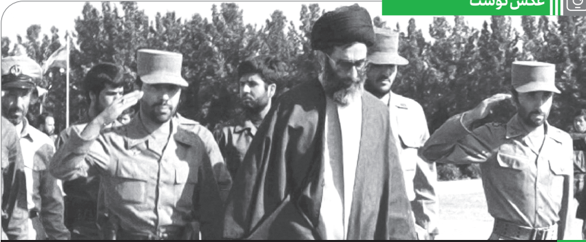
شهید صیاد شیرازی در کنار رهبر انقلاب