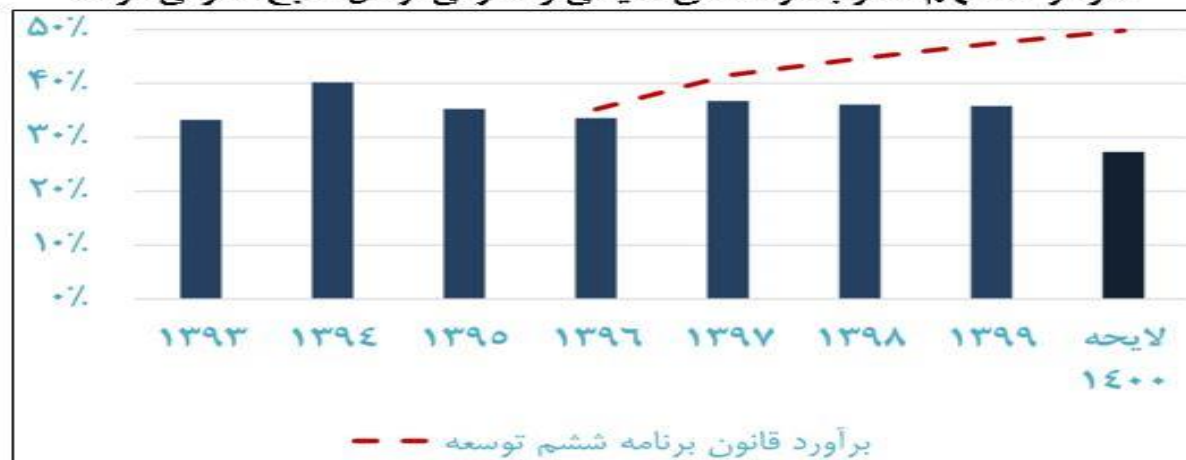
نمودار ۲. سهم مصوب درآمدهای مالیاتی و گمرکی از کل منابع عمومی دولت

با توجه به پیش‌بینی منابع قابل توجه از محل منابع حاصل از صادرات نفت در قوانین بودجه ۱۳۹۸ و ۱۳۹۹ و لایحه بودجه ۱۴۰۰، سیاستگذار عملاً خود را نیازمند به ایجاد منابع درآمدی پایدار یا مدیریت و کاهش هزینه‌ها ندید و نخواهد دید؛ چراکه با پیش‌فرض رفع تحریم‌ها و بودجه‌ریزی بر مبنای آن، تنگنای مالی از بین رفته و دیگر نیازی به تحمل هزینه سیاسی لازم برای اصلاح منابع و مصارف بودجه نخواهد بود. اما با پیش‌فرض تداوم تحریم‌ها، دولت باید یا از هزینه‌های خود بکاهد یا برای تأمین منابع، به دنبال شناسایی منابع جدید و پایدار باشد. نمودار زیر، روند نزولی نسبت درآمدهای مالیاتی و گمرکی به کل منابع بودجه در سال‌های اخیر را نشان می‌دهد.