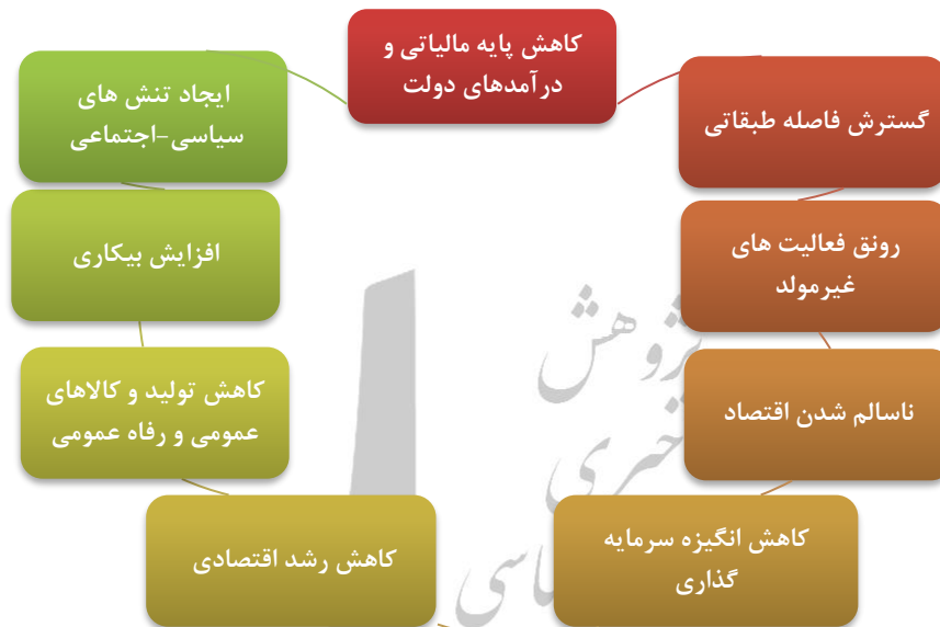
شکل شماره ۱- پیامدهای فرار مالیاتی و وجود معوقات مالیاتی

واردات کالاهای ضروری و سرمایه‌ای تخصیص نیابد. همان طور که در شکل شماره ۱ مشاهده می‌شود، فرار مالیاتی و معوقات مالیاتی به گسترش فاصله طبقاتی، کاهش رشد اقتصادی و ... منجر می‌شوند ۱ .