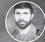
شهید امیر سپهبد صیاد شیرازی