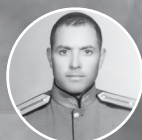
شهید امیر سر لشکر ابرج رستمی

اوائل انقلاب، در یکی از این کاخهای سلطنتی که یک بخشی از نیروی ارتش را آنجا برای پاسداری متمرکز کرده بودند، یک تابلویی آن بالا زده بودند که مضمونش این بود: ما - یعنی ارتش - اصلاً برای حفظ جان این طاغوت تشکیل شده‌ایم! خب، این خیلی فاصله دارد با منافع ملی. اگر مادر دنیا ارتشی را پیدا کنیم که اعتقاداتش مثل اعتقادات مردم، احساساتش مثل احساسات مردم، خودش نه در خدمت اشخاص و افراد، بلکه در خدمت مردم و در خدمت منافع ملی به معنای حقیقی باشد، این ارتش خیلی ارزش دارد؛ این ارتش شماست. من مورد دیگری را واقعاً سراغ ندارم. ۹۱/۲/۳