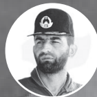
شهید امیر سرلشکر خلبان عباس بابایی