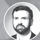
شهید امیر سر لشکر موسی نامجو