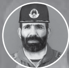
شهید امیر سرلشکر خلیبان مصطفی اردستانی