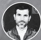
شهید امیر سر لشکر محمود خضرائی