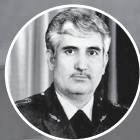
شهید امیر سرلشکر منصور ستاری