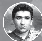
شهید امیر سر لشکر خلبان عباس دوران