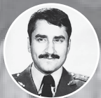
شهید امیر سرلشکر خلیبان سیدعلیر ضیاسینی