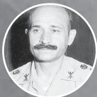
شهید امیر سرلشکر ولی‌الله فلاحی