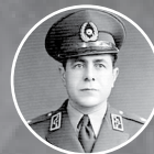
شهید امیر سپهبد ولی‌الله قرنی