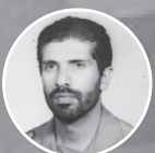
شهید امیر سر لشکر حسن آقارب پرت