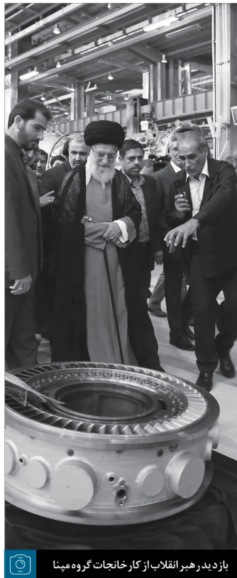
بازدید رهبر انقلاب از کارخانجات گروه مینا

من فراموش نمی‌کنم در سال‌های اوائل دهه‌ی ۶۰ که بنده رئیس جمهور بودم، ما در یک نقطه‌ای از کشور که نمی‌خواهم بگویم کجا، یک نیروگاه گازی نصفه کاره داشتیم؛ ما اصرار می‌کردیم، می‌گفتیم به آنها که این نیروگاه را باید خودمان تمام کنیم؛ مسئولانی آمدند پیش من - بعضی شان زنده‌اند، بعضی شان هم خدا رحمت کند؛ از دنیارفته‌اند - می‌گفتند آقا! نمی‌شود؛ بیخود زحمت نکشید، بیخود تلاش نکنید. آمده بودند به بنده اثبات کنند و بنده را قانع کنند که ما نمی‌توانیم... امروز شما جوان‌های این کشور، فعالان این کشور و مدیران جهادی بارز، توانسته‌اید خودتان را به رتبه‌ی بالای ساخت نیروگاه‌های گازی - یعنی رتبه‌ی ششم دنیا - برسانید... آن سال‌ها به ما می‌گفتند نمی‌شود، اما با پشتکار، با همت، با توکل به خدای متعال، با تشویق نیروهای با استعداد، با عزم راسخی که مدیران ما به کار بردند، این کار اتفاق افتاد. ۹۳/۲/۱۰