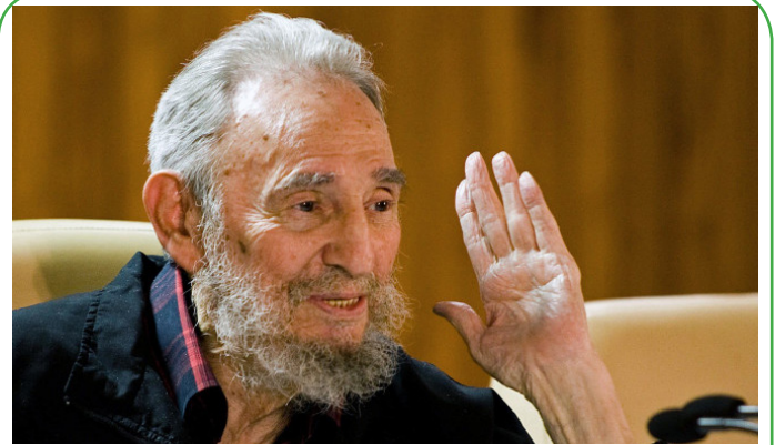
فیدل کاسترو رهبر انقلابی کوبا در ۹۰ سالگی در گذشت