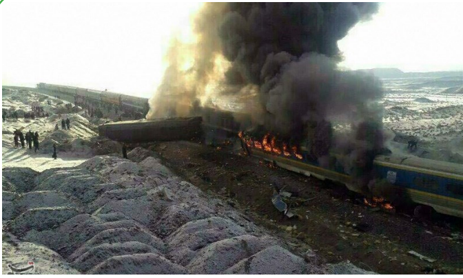
برخورد ۲ قطار مسافربری در محور سمنان