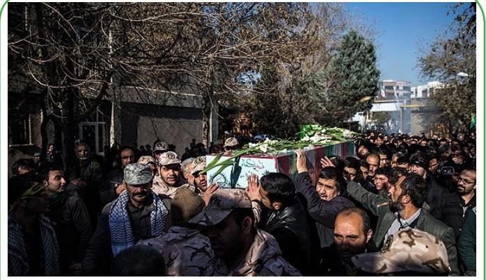
تشییع پیکر دو شهید گمنام در دانشکده فنی انقلاب اسلامی