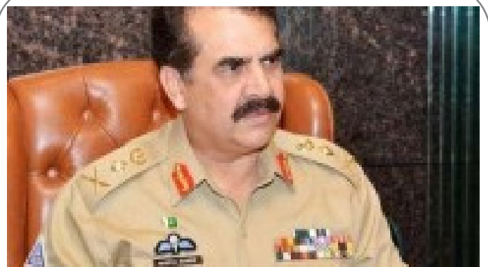
قمر جاوید فرمانده جدید ارتش پاکستان