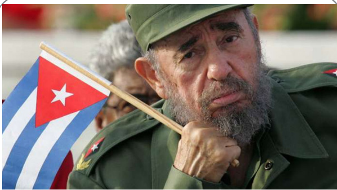
درگذشت رهبر انقلاب کوبا