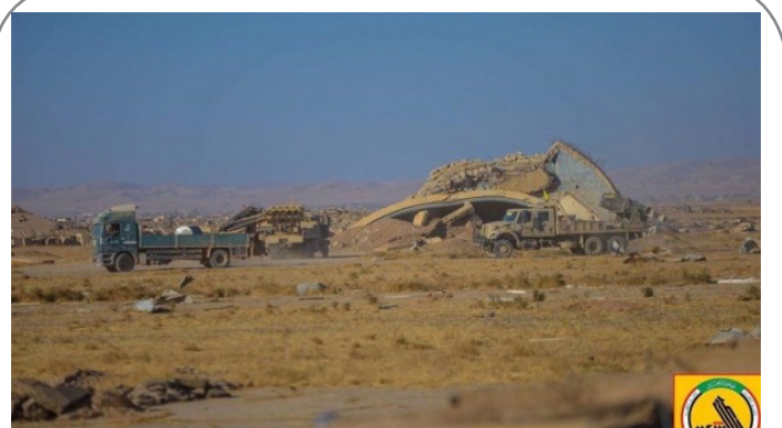
حمله موشکی به فرودگاه تلعفر عراق