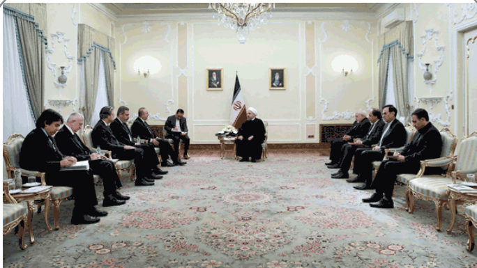
دیدار رئیس جمهور ایران و وزیر خارجه ترکیه