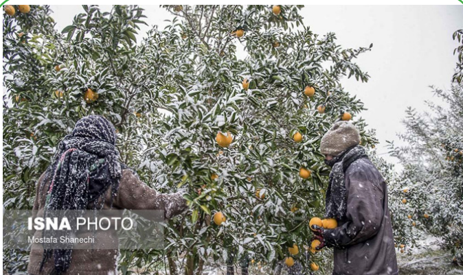
باغهای سرمازده و خسارت دیده ناشی از بارش برف در استان مازندران