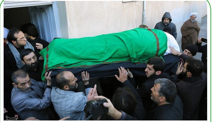
قم - مراسم تشییع آیت الله موسوی اردبیلی