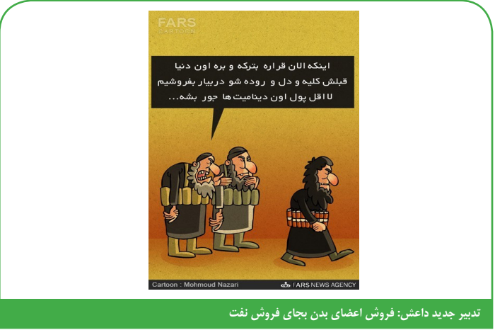
تدبیر جدید داعش: فروش اعضای بدن بجای فروش نفت