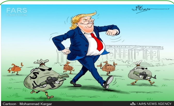
محافظت از ترامپ روزی یک میلیون دلار خرج دارد!