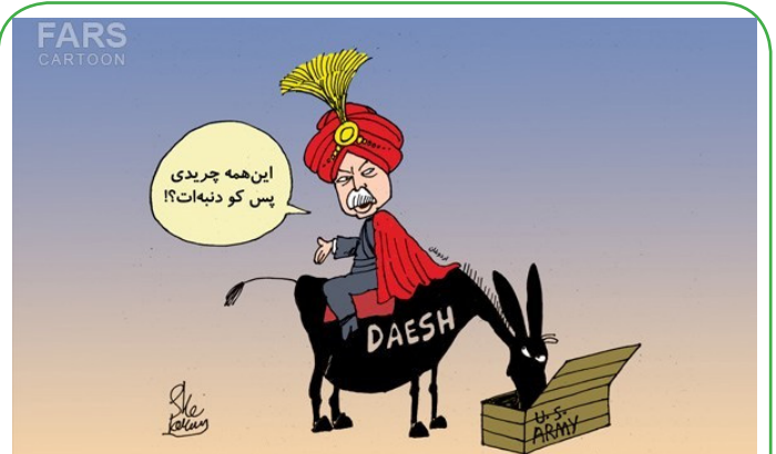
نتیجه کمک‌های اردوغان به داعش