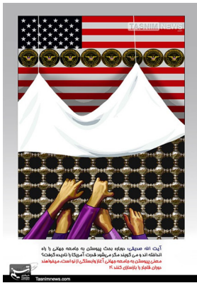
می خواهند دوران قاجار را بازسازی کنند