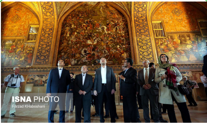
سفر رئیس شورای ریاست جمهوری بوستنی به اصفهان