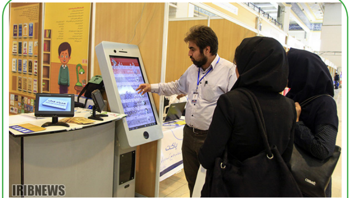
دهمین نمایشگاه رسانه های دیجیتال