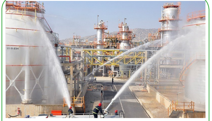
ایلام - آزمایش عملیاتی پدافند غیرعامل پتروشیمی