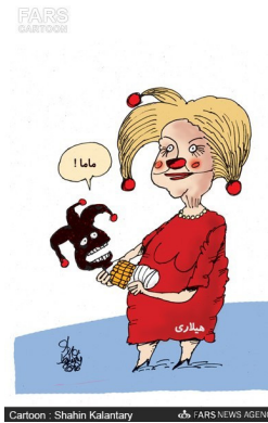
پنتاگون ارتباط میان واشنگتن و داعش را مضحک خواند!