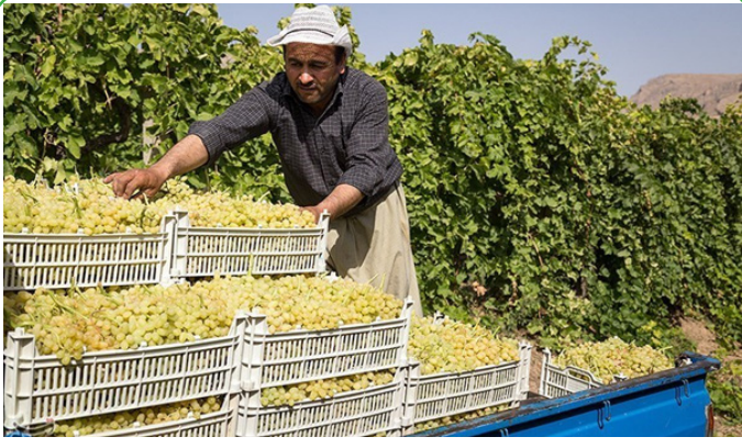
ارومیه - برداشت انگور