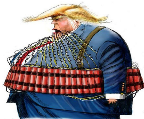
ژست جدید ترامپ