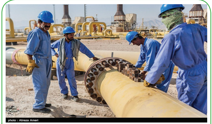
فارس - تعمیرات اساسی پالایشگاه گاز بارسینان