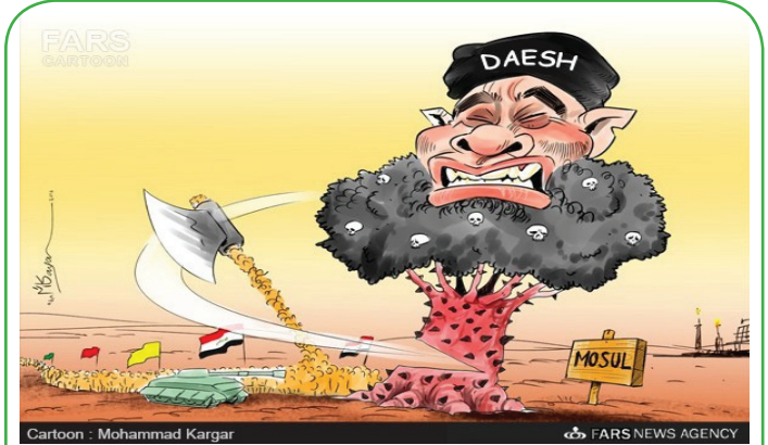
عزم عراق برای قطع درخت داعش از موصل