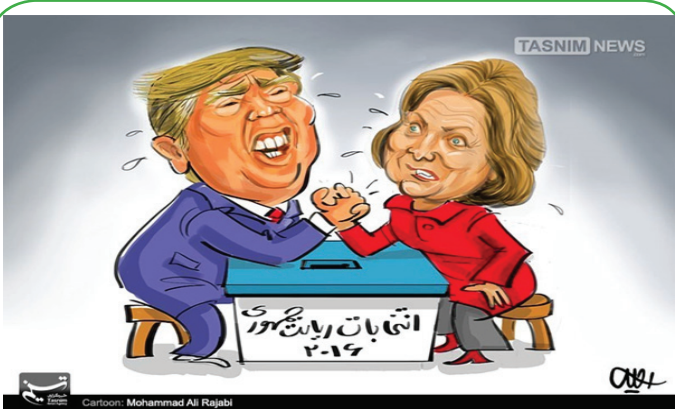
مناظرات انتخاباتی آمریکا