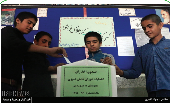
انتخابات شوراهای دانش آموزی در خراسان رضوی