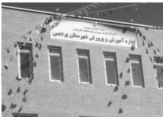
تبدیل مدرسه ۶۰۰ نفره به اداره آموزش و پرورش پردیس!