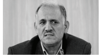
در بحث سایبری مصرف کننده ایم

در جلسه ۶۳ مجمع شورای تخصصی حوزوی شورای عالی انقلاب فرهنگی، اعضای این شورا ضمن ابراز نگرانی از ضعف حاکم بر بخش فرهنگی برنامه ششم توسعه، خواستار ساماندهی فضای مجازی شدند. حجت الاسلام والمسلمین سالک، نایب رئیس کمیسیون فرهنگی مجلس شورای اسلامی در گزارشی با اشاره به تلاش های صورت گرفته در کمیسیون فرهنگی مجلس شورای اسلامی، گفت: موضوعات و بندهای مهمی در برنامه ششم توسعه با توجه به خلأها و ضعف های جدی موجود در برنامه تقدیمی دولت به تصویب کمیسیون فرهنگی رسیده است. اعضای شورا همچنین بر توجه ویژه به پیوست نگاری فرهنگی در طرح های کلان و مهم، ساماندهی فضای مجازی و تدوین الگوی سبک زندگی اسلامی ایرانی تاکید کردند.