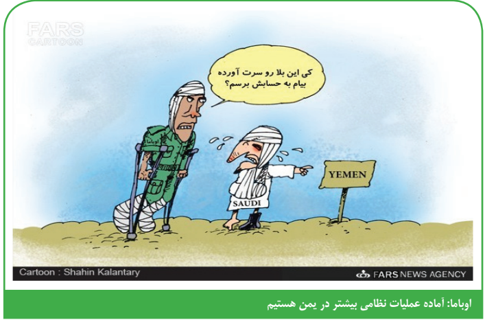
اوباما: آماده عملیات نظامی بیشتر در یمن هستیم