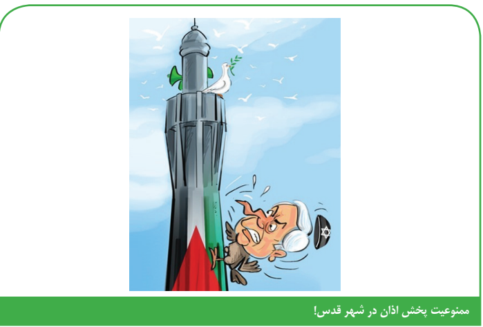
ممنوعیت پخش اذان در شهر قدس!