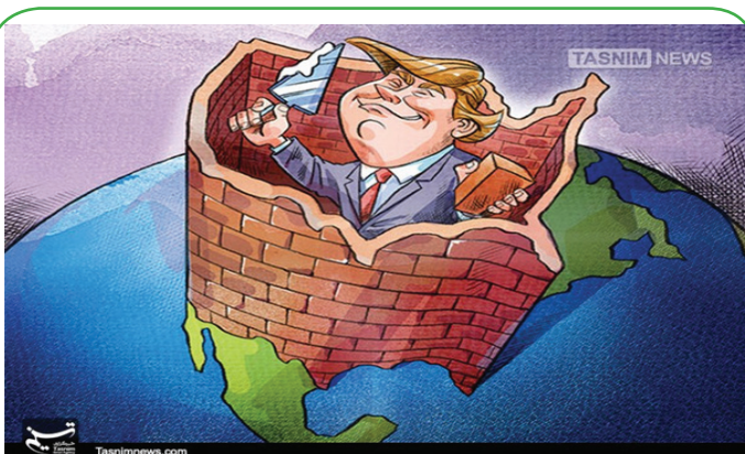
آزادی از دیدگاه ترامپ!