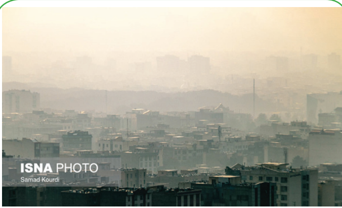
آلودگی هوای کرج