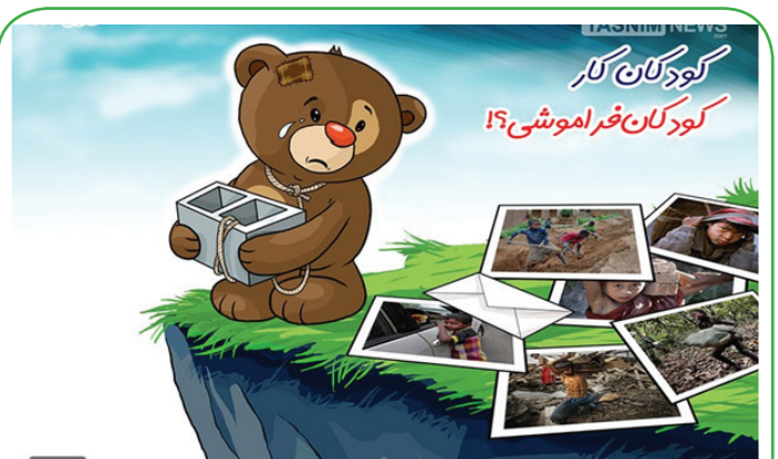
کودک قربانی کار اجباری!