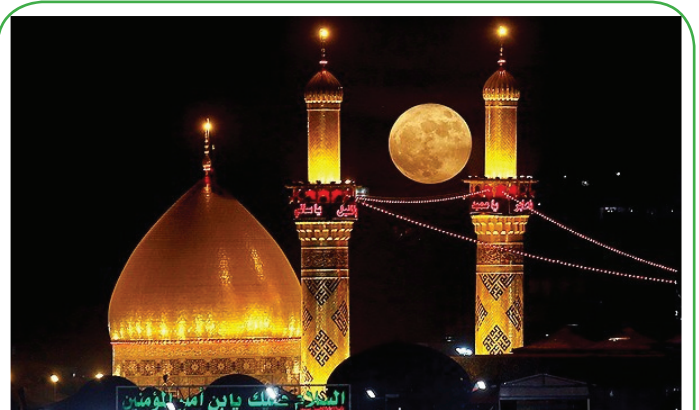
رصد بزرگ‌ترین ماه ۷۰ سال گذشته