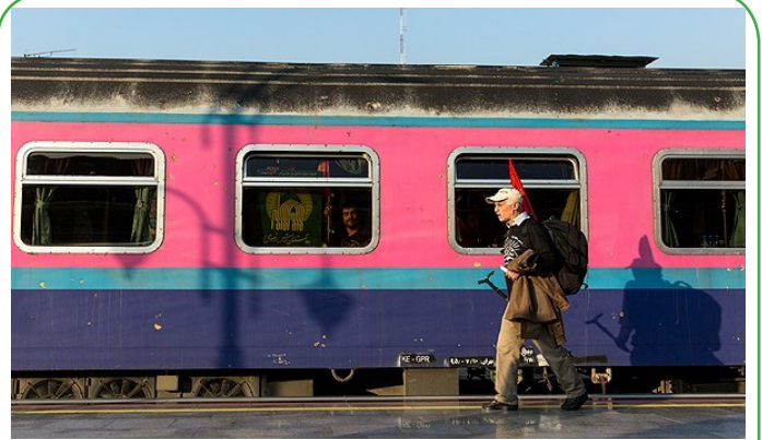
راهاندازی قطار ترکیبی تهران - کرمان