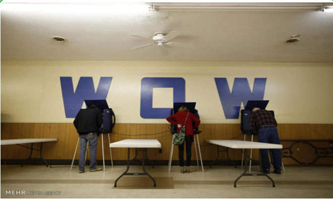
انتخابات در آمریکا