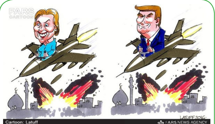
Cartoon : Latuff FARS NEWS AGENCY