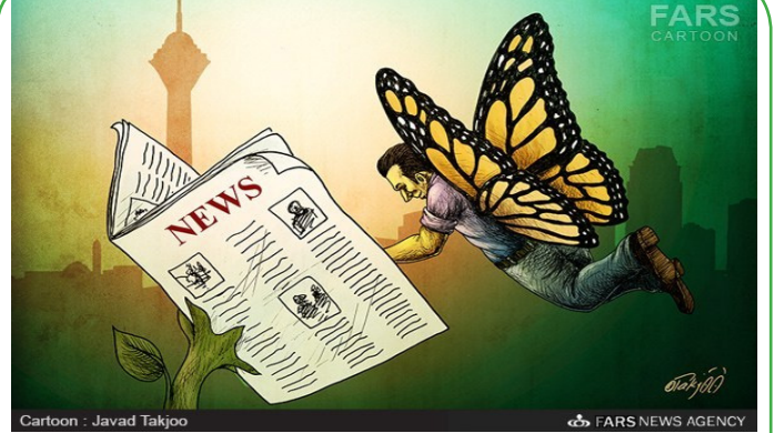
Cartoon : Javad Takjoo FARS NEWS AGENCY