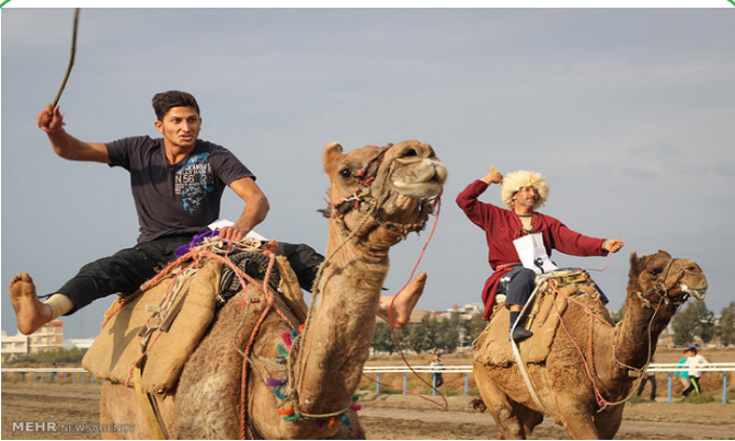
نخستین دوره مسابقات شترسواری در بندر ترکمن