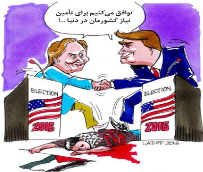
Cartoon : Latuff FARS NEWS AGENCY