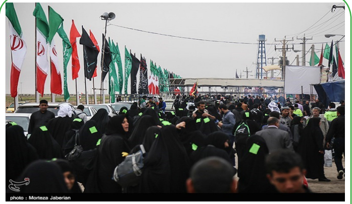
خوزستان - خروج زائران حسینی از مرز جاذبه