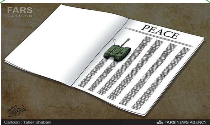
به مناسبت جشنواره مطبوعات