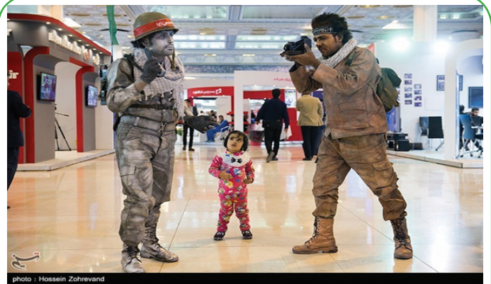
بیست و دومین نمایشگاه مطبوعات