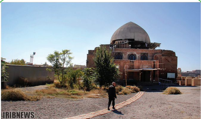
اردبیل - مسجد اعظم عتیق، ثبت شده در آثار ملی