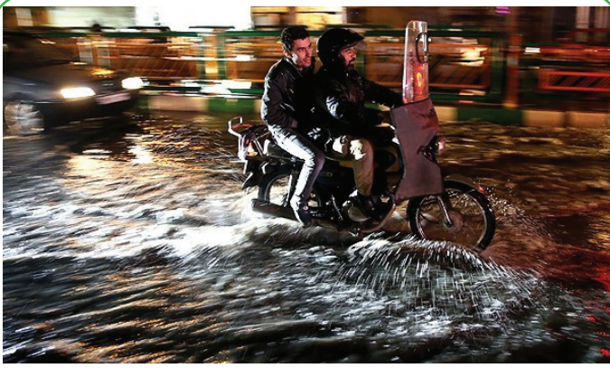
تهران - آبگرفتگی معابر به دنبال بارش باران