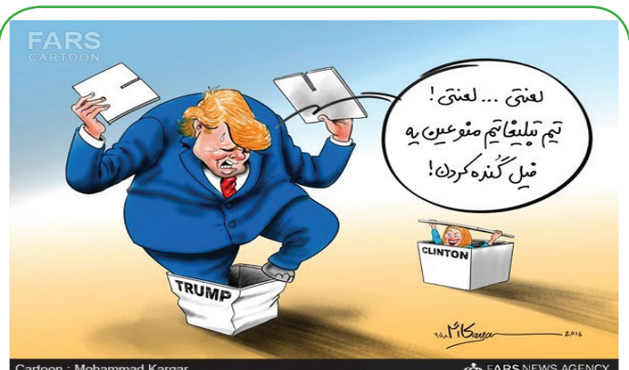
Cartoon : Mohammad Kargar