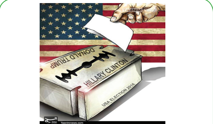
انتخابات دو سر باخت در آمریکا