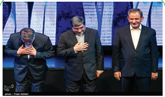
مراسم تودیع و معارفه وزیر فرهنگ و ارشاد اسلامی