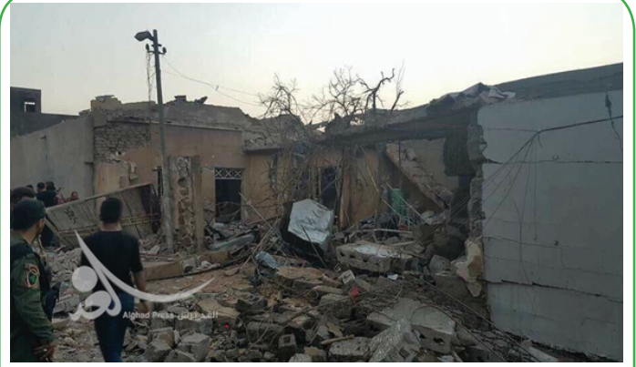
عراق - حمله یک جنگنده ناساس به یک حسینیه در جنوب کرکوک