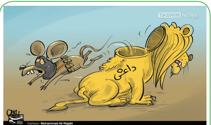
موشی در لباس شیر!