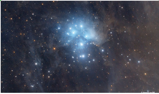
عکس روز ناسا - خوشه هفت خواهران