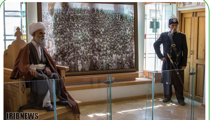
اصفهان - خانه بیداری اسلامی