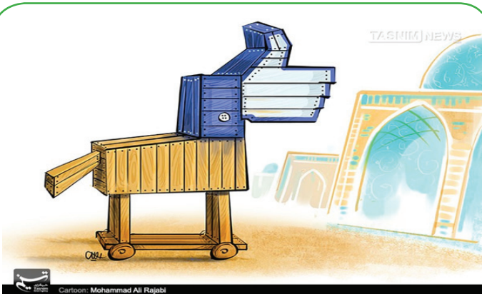
تراوای نفوذ فرهنگی!