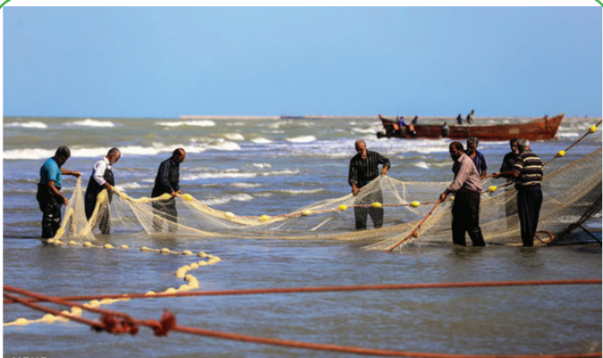
آغاز فصل ماهیگیری دریای خزر