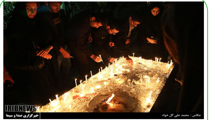
تهران - مراسم شام غریبان