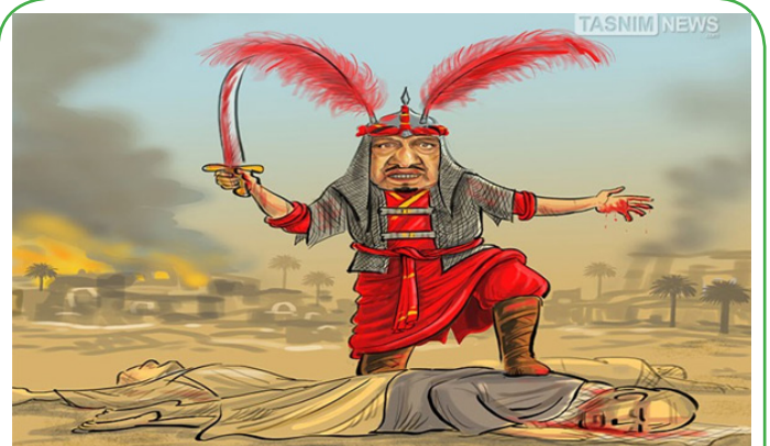
شمر زمانه ات را بشناس