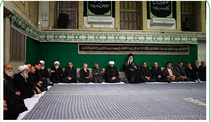
عزاداری شب های محرم در حسینیه امام خمینی (ره)