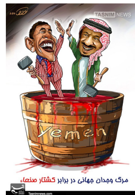
مرگ و میدان جهانی در برابر کشتار منشاء