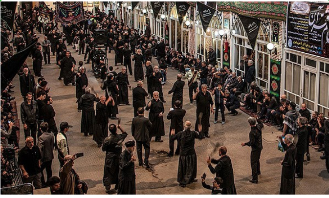
تبریز - مراسم عاشورای حسینی