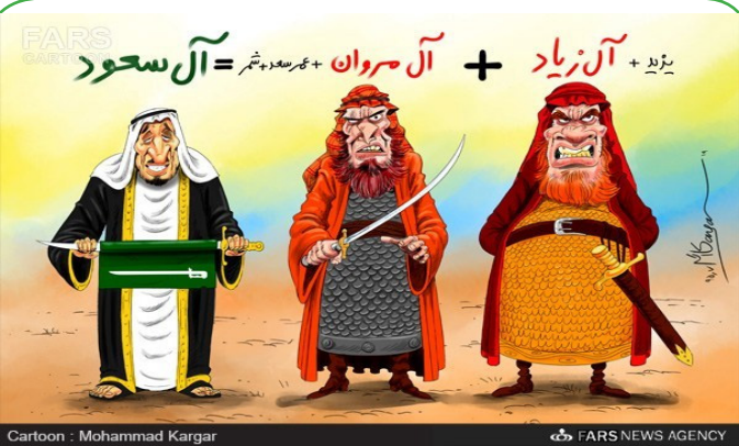
احیای مجدد اشقیاء = آل سعود