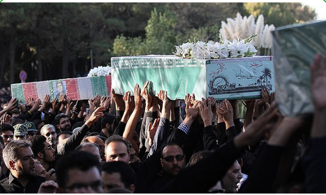
اصفهان - تشییع شهدای دفاع مقدس و مدافع حرم