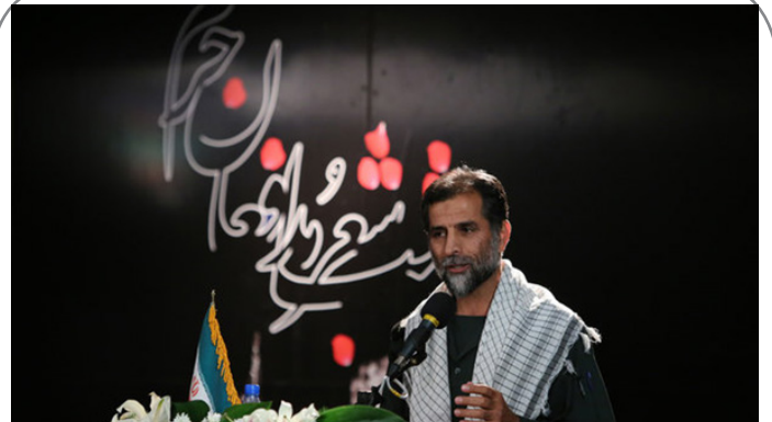
نخستین شب شعر مدافعان حرم با حضور خانواده های شهدا