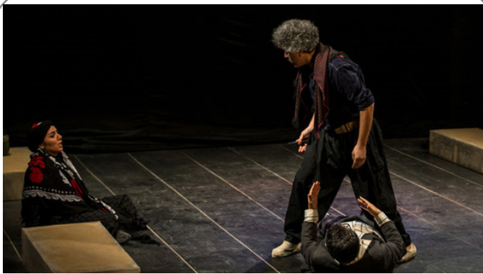
نمایش خاک شیرین به نویسندگی حامد مکملی و کارگردانی مرتضی نجفی