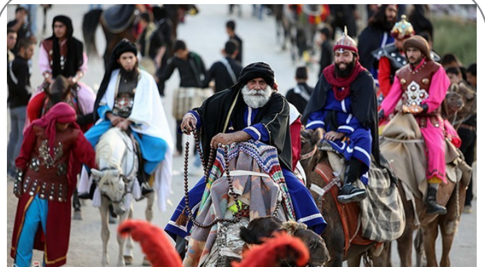
اصفهان - مراسم آیینی در ماه محرم