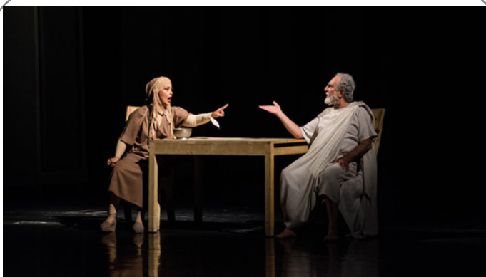
اجرای نمایش سقراط به کارگردانی حمیدرضا نعیمی