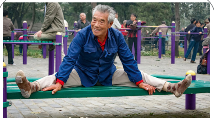
انگیس - عکس برگزیده مسابقه بین المللی عکاسی با موضوع سالمندان