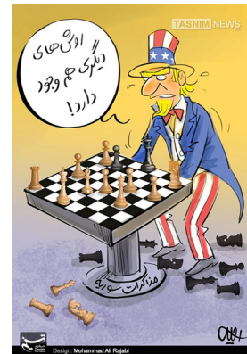
میز بازی سوریه!