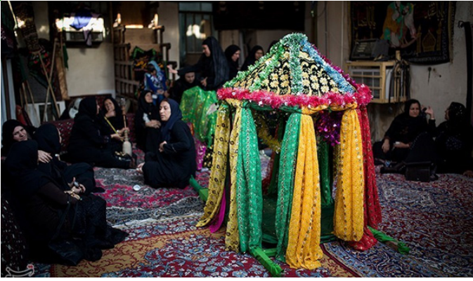
بوشهر - آیین سنتی حجله حضرت قاسم(ع)