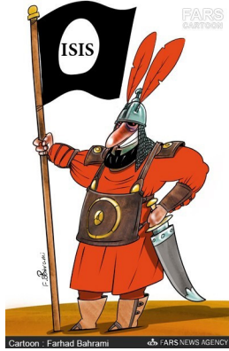
همزمان تاریخی داعش!