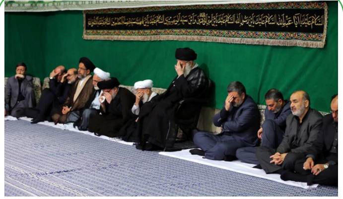
مراسم عزاداری حضرت اباعبدالله الحسین (ع) با حضور رهبر انقلاب اسلامی