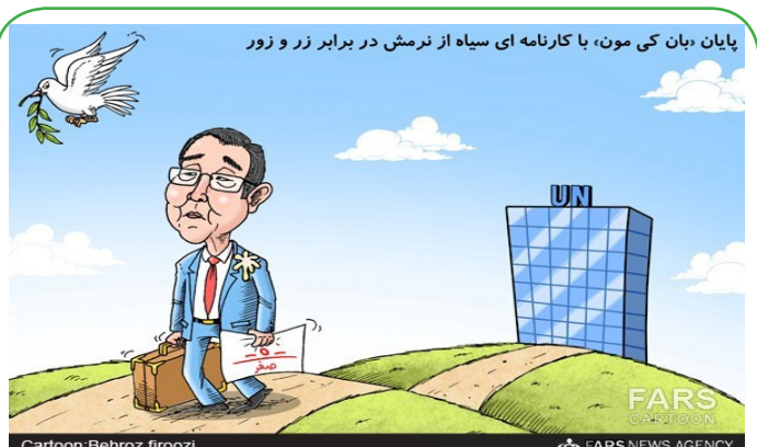
پایان «بان کی مون» با کارنامه ای سیاه