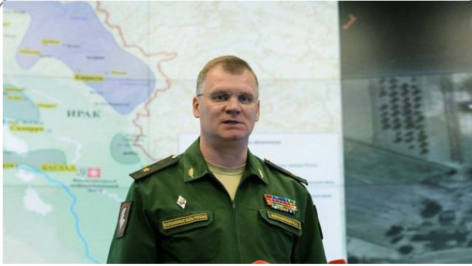
هشدار وزارت دفاع روسیه به آمریکا درباره حمله به خاک سوریه