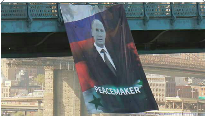
نصب بنر پوتین با عنوان ایجاد کننده صلح، از سوی افراد ناشناس در پل منهتن آمریکا