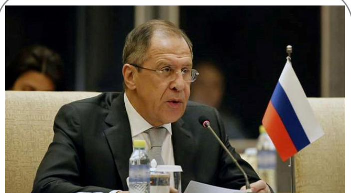
لاوروف وزیر خارجه روسیه: هیچ‌گاه با داعش و النصره در سوریه آتش بس نمی‌کنیم