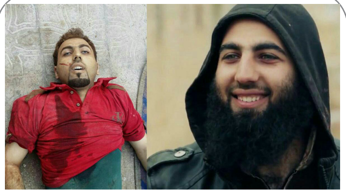
هلاکت هشام خلیفه از فرماندهان تروریست‌های تکفیری در انفجار گذرگاه مرزی ترکیه