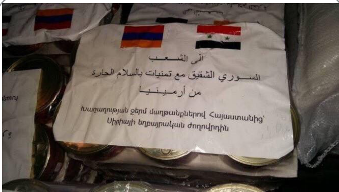
محموله کمک‌های انسان دوستانه دولت ارمنستان به مردم سوریه