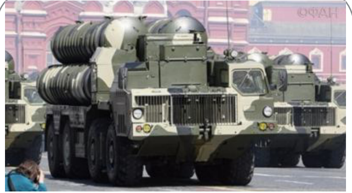
درخواست رژیم صهیونیستی از روسیه برای در اختیار گذاشتن طریقه مقابله با اس ۳۰۰