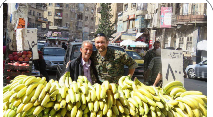
عکس یادگاری سرباز روس با میوه فروش سوریه در حلب