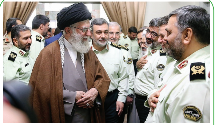
دیدار فرماندهان نیروی انتظامی با مقام معظم رهبری