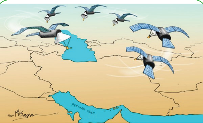
یک سوم ماهواره ها روی ایران متمرکز هستند