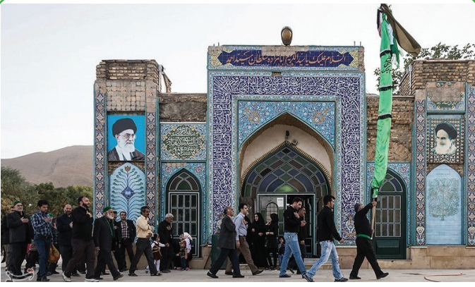
اراک - علم گردانی در روستای هزاره