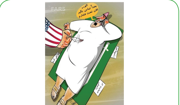
آمریکا بی سروصدا به عربستان فشار آورده؟!