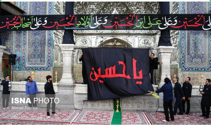
قم - تعویض پرچم گنبد حرم حضرت معصومه (س) در آستانه محرم