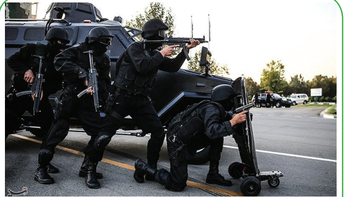
مانور اقتدار یگان های ویژه ناجا