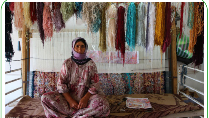
اردبیل - فعالان اقتصاد مقاومتی