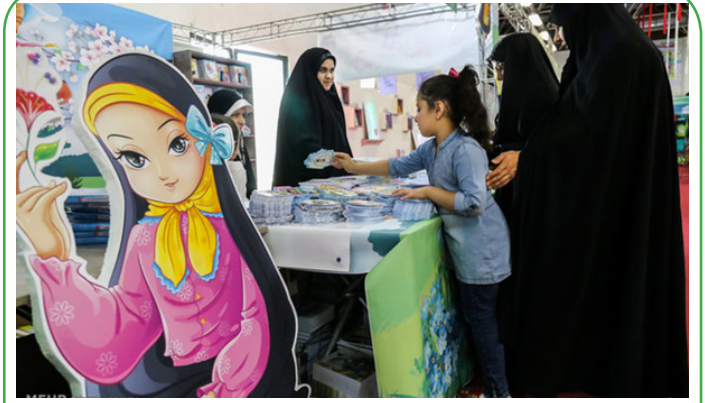
تهران - کانون پرورش فکری کودکان و نوجوانان؛ نمایشگاه نوشت افزار ایرانی اسلامی