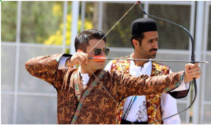
شیراز - مسابقات تیراندازی با کمان سنتی