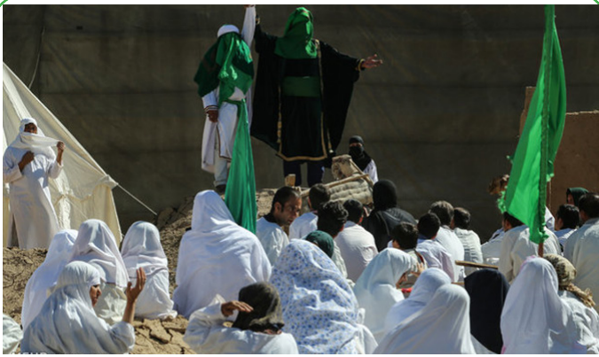
نمایش بازسازی واقعه غدیر خم در شهرهای مختلف کشور