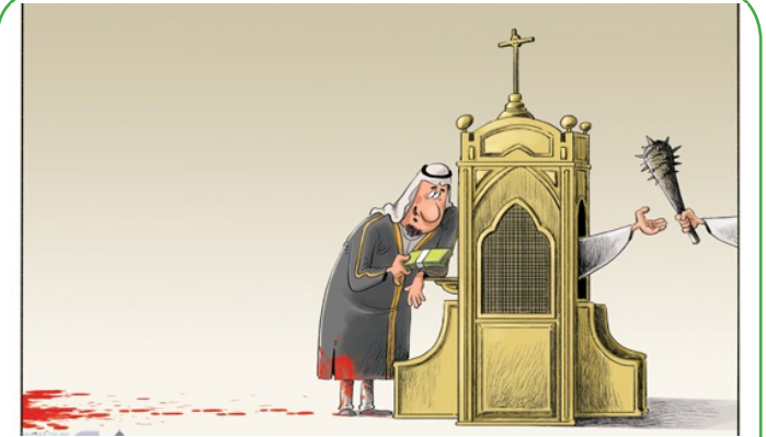
سنگل جدید سعودی