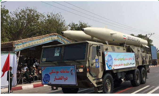
آغاز هفته دفاع مقدس - رونمایی از موشک ذوالفقار در رژه نیروهای مسلح