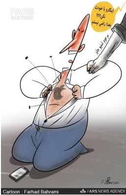
سینه چاکان ابل