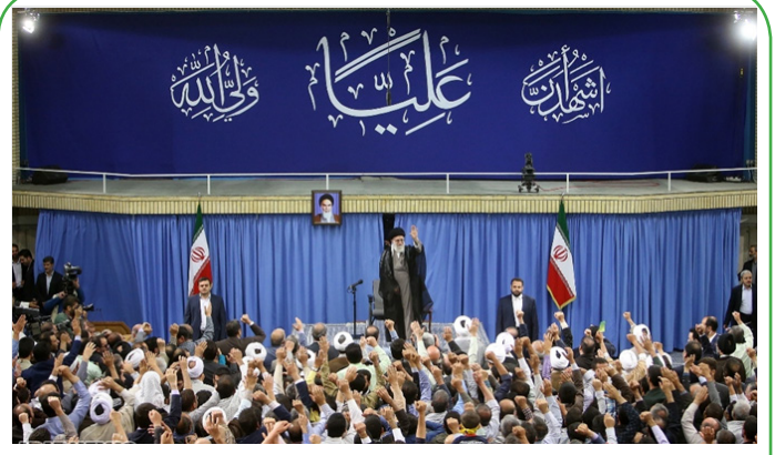
دیدار اقشار مختلف مردم با رهبر انقلاب در عید ولایت