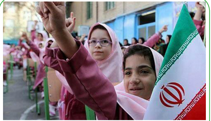
آغاز سال تحصیلی برای یک میلیون و ۴۰۰ هزار کلاس اولی