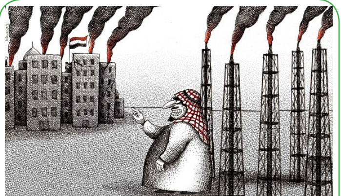
به بار نشستن میوه تلخ دلارهای نفتی سعودی در یمن!