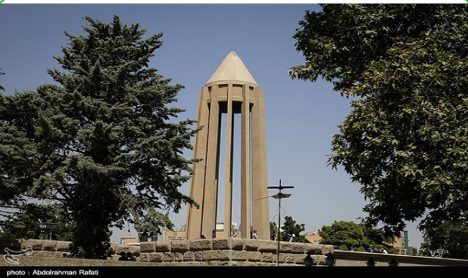
همدان - آرامگاه ابوعلی سینا