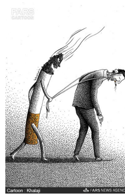
اعتیاد نیروی جوان و مولد کشور را هدف گرفته است!