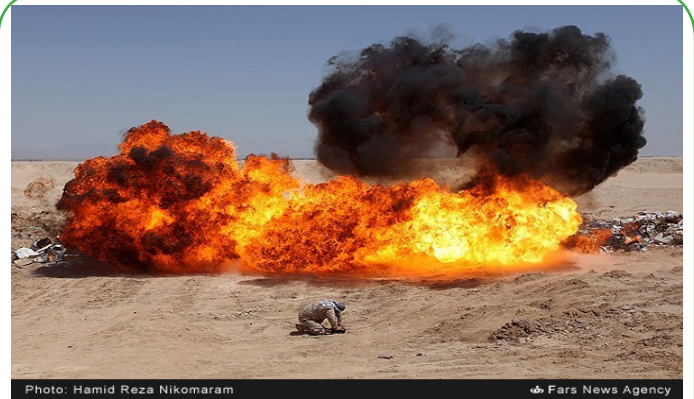
اصفهان - انفجرام گالای قاجاق