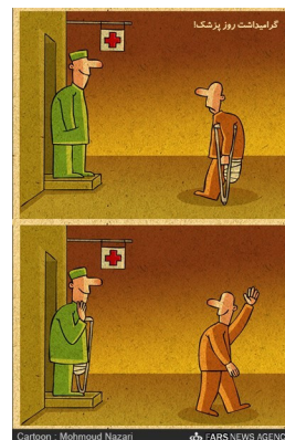
گرامیداشت روز پزشک