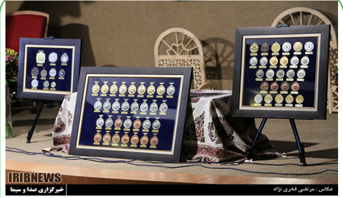
اهدای مدال‌های نخبگان به رهبر انقلاب