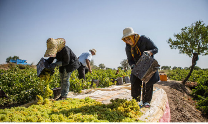
قزوین - فصل برداشت انگور از باغ های تاکستان