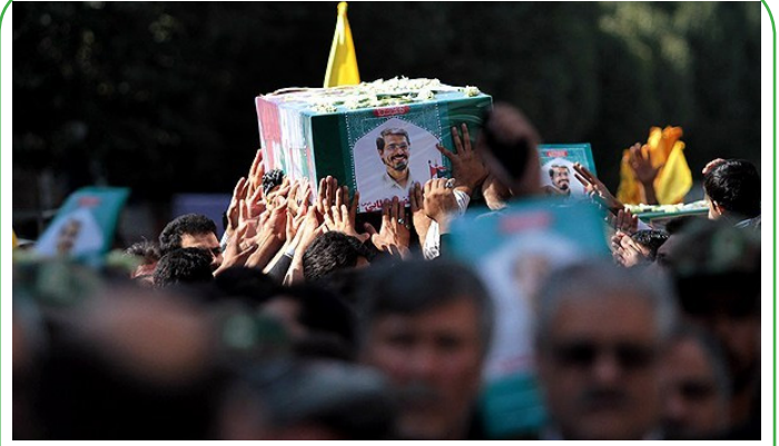
مشهد - تشییع بیکرمطهر ۳ شهید مدافع حرم