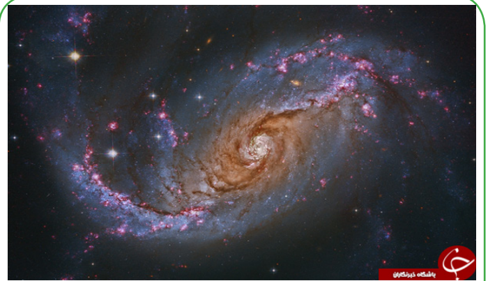
عکس روز ناسا - کهکشان خوشه های ستارگان آبی