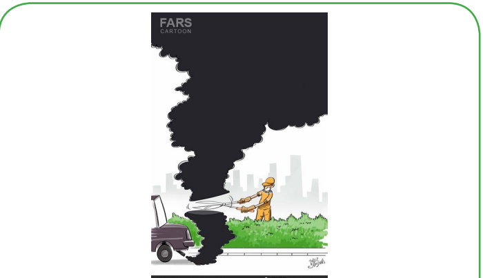
عامل ۴۵ درصد آلودگی تهران، ۱۰ درصد خودروهای کاربراتوری است!