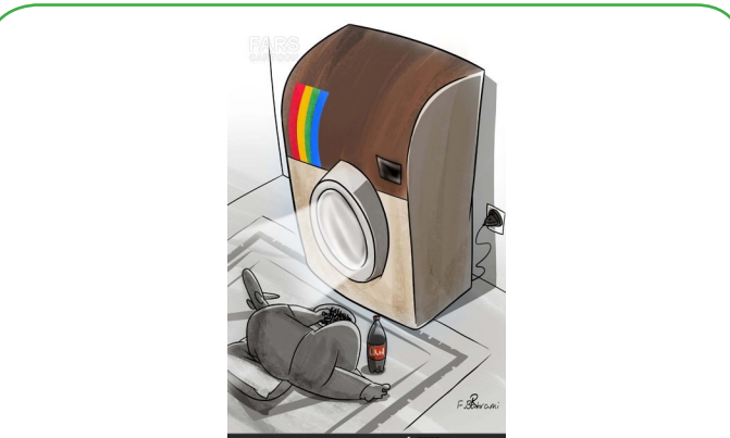
سرگرمی به توان اینستاگرام!