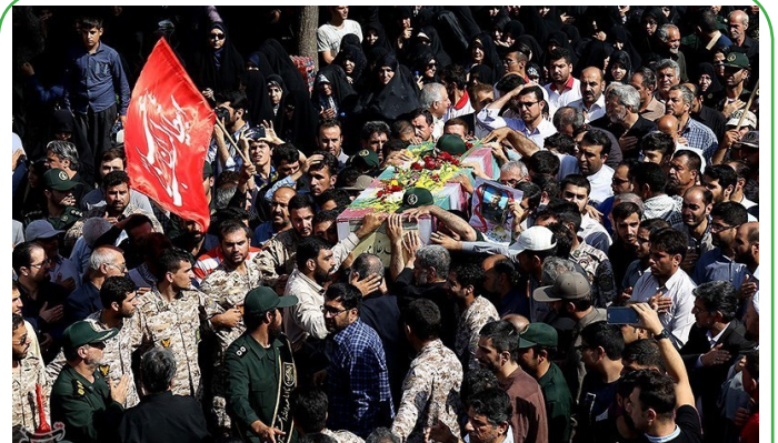
تشییع بیگر شهید مدافع حرم سردار احمد غلامی