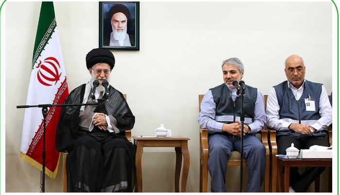
دیدار مسئولان ستاد سرشماری نفوس و مسکن با مقام معظم رهبری