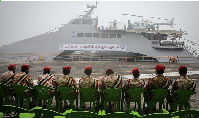
بوشهر - مراسم الحاق شناور شهید ناظری به ناوگان دریایی