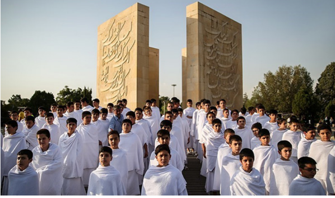
بهشت زهرا (س) - مراسم بزرگداشت شهدای منا