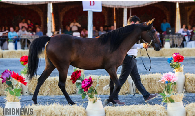
مسابقات اسب زیبای ایرانی