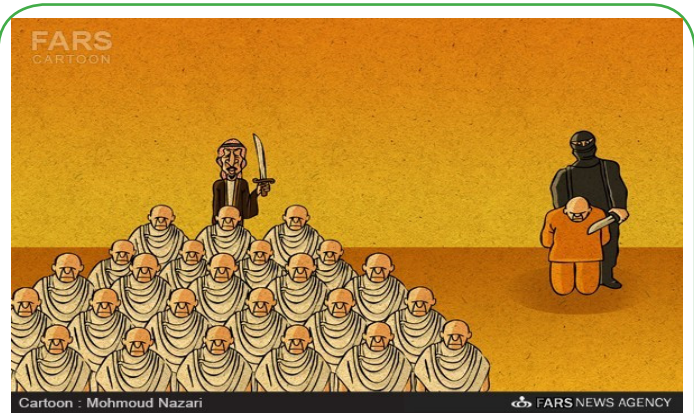
حادثه منا، به سبک داعش!