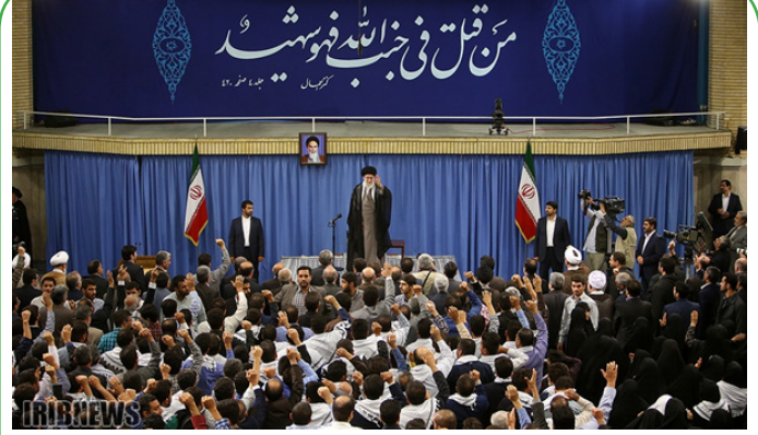
دیدار خانواده‌های شهدای منا و مسجد الحرام با رهبر انقلاب