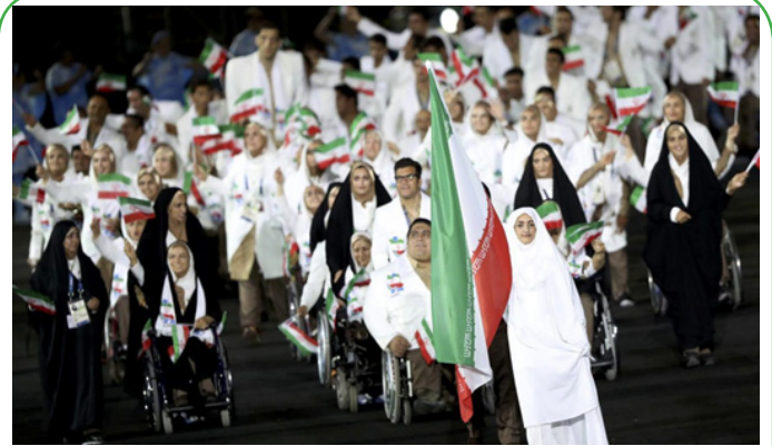
رژه کاروان ورزشی ایران در مراسم افتتاحیه مسابقات پارالمپیک ریو ۲۰۱۶