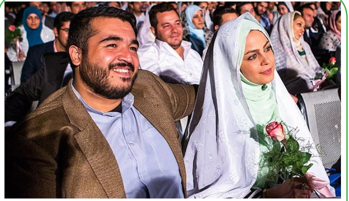
برج میلاد - جشن عقد ۵۰۰ زوج جوان