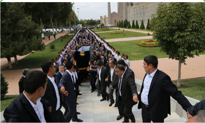
تشییع جنازه رئیس جمهور ازبکستان باحضور محمد جواد ظریف - سمرقند