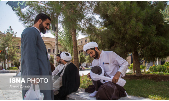
ISNA PHOTO Ahmad Zohrabi