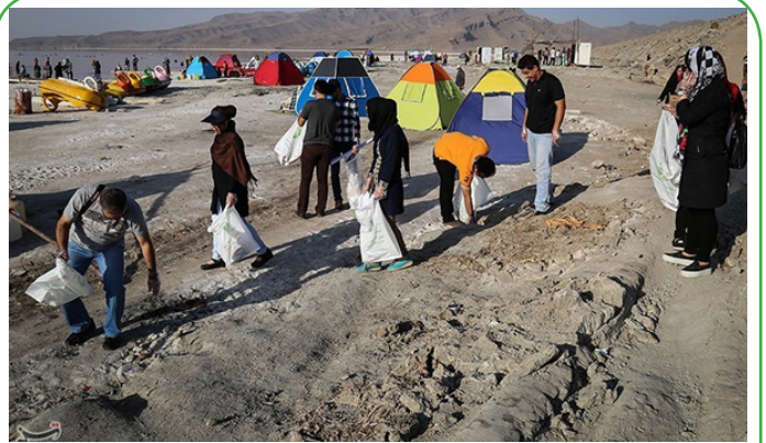
پاکسازی میان گذر دریاچه ارومیه