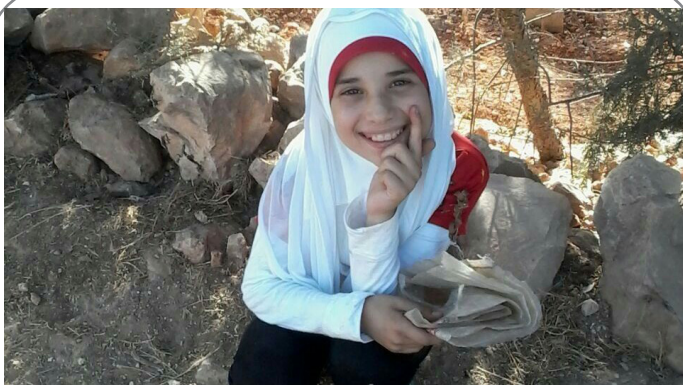
شهادت آیه احمد سطح، دختر بچه شیعه سوری در حمله تروریستهای تکفیری