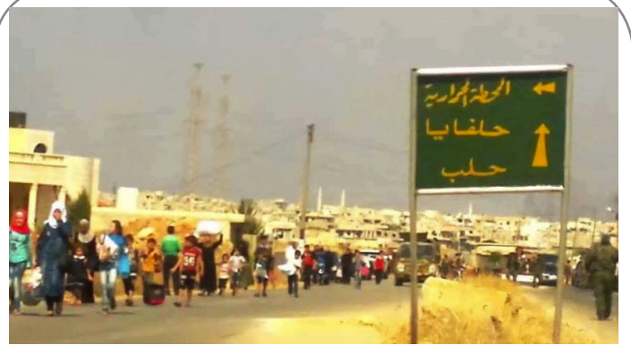
مردمی که در حمله تروریستها به حلفایای سوریه آواره شدند