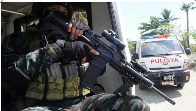
کشته شدن ۱۲ نیروی امنیتی فیلیپین در نبرد با تروریستهای گروه ابوسیف