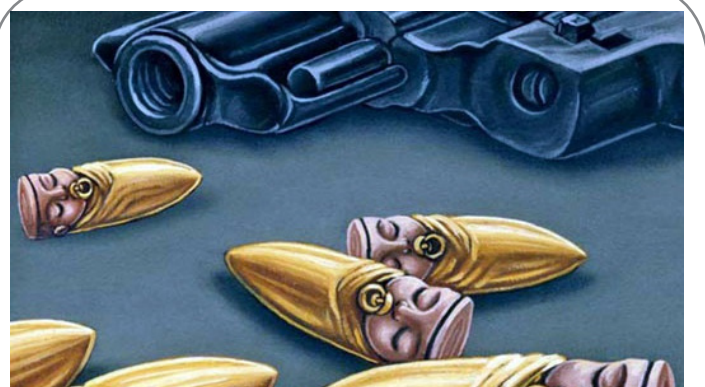
سوء استفاده داعش از کودکان برای عملیات انتحاری