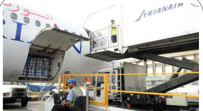
ارسال نخستین محموله دارویی کوبا به سوریه