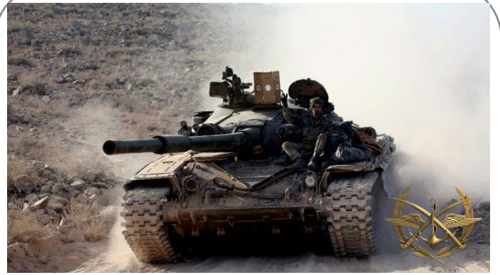
سامانه جدید "سراب" روی نفربرها و تانک‌های مقاومت و ارتش سوریه