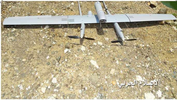
پهپاد سعودی که رزمندگان یمنی آن را ساقط کردند