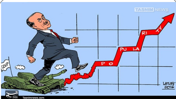
منافع کودتا برای اردوغان!