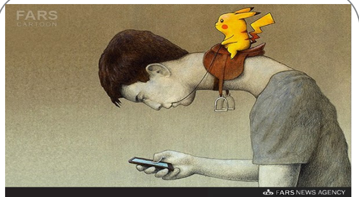
برده داری مدرن به سبک «پوکمون گو»!