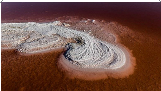
تغییر رنگ دریاچه ارومیه