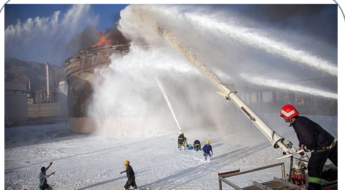
آتش سوزی در پتروشیمی بیستون