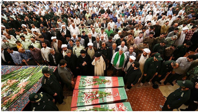
تشییع پیکر شش شهید گمنام دفاع مقدس در گرگان