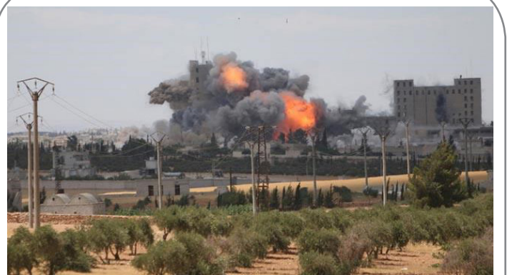
داعش از "منبج" با ۲۰۰ خودروی حامل گروگان گریخت