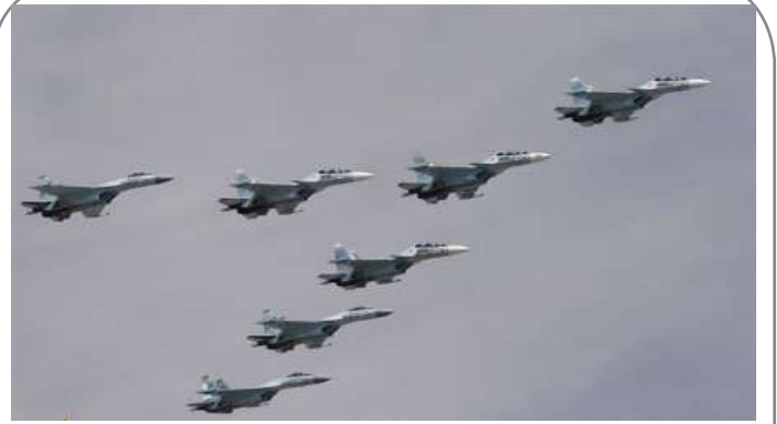
سومین حمله روسیه از همدان به مواضع داعش در سوریه