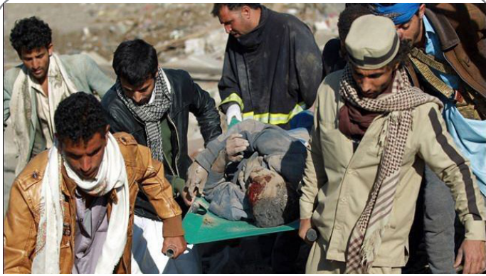
شهادت ۵ یمنی و مجروحیت ۸ تن در تازه ترین حملات سعودی ها به صعده