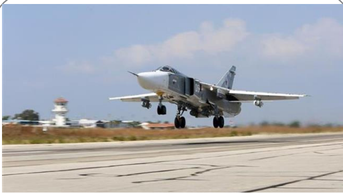
عملیاتی شدن بمب افکن های مدرن سازی شده روسیه ( TU22M3M )