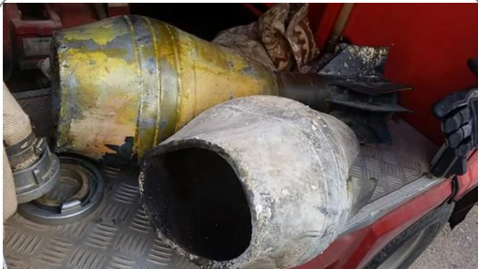
حمله شیمیایی داعش در شمال سوریه