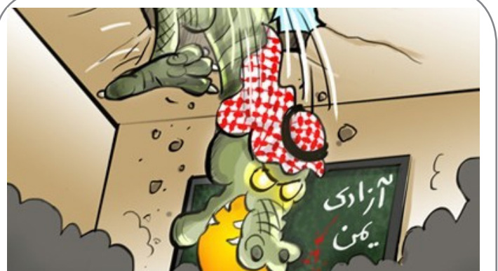
حمله سعودی به مدارس یمن