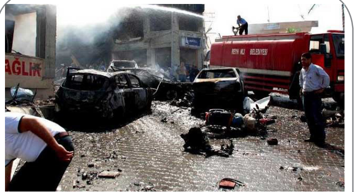
۹ کشته و ۱۹۳ زخمی در انفجارهای شرق ترکیه