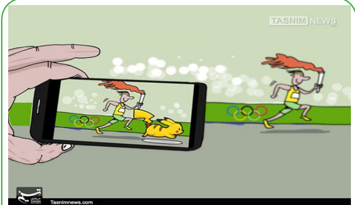
رقابت‌های المبیک ۲۰۱۶ ریو TASNIM NEWS Tasnimnews.com