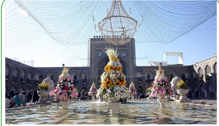
مشهد الرضا - گل آرایی حرم مطهر رضوی در آستانه میلاد امام هشتم