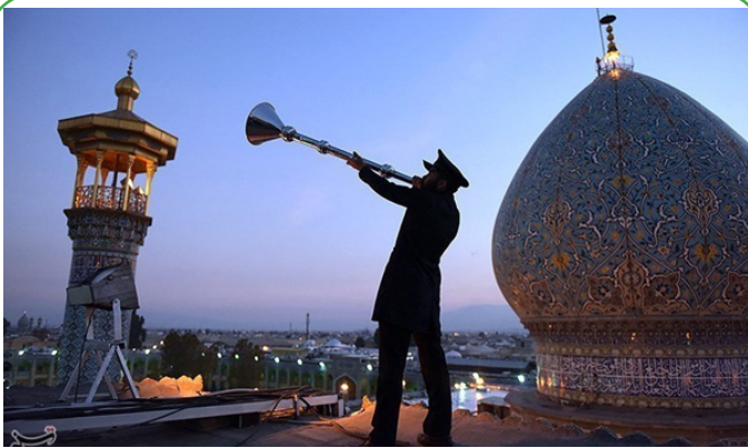
سیراز - روز بزرگداشت حضرت احمد بن موسی شاهچراغ (ع)