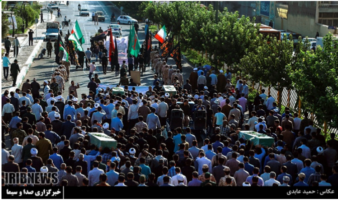
قم - تشییع ۴ شهید مدافع حرم