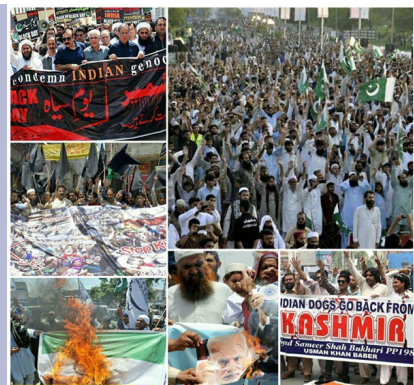
تظاهرات روز سیاه در پاکستان در حمایت از مردم کشمیر