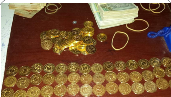
سکه های ضرب شده داعش در شهر دیرالزور