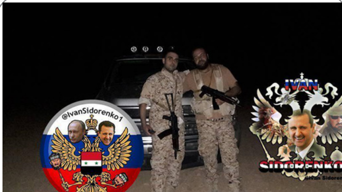
سربازان ارتش سوریه در کنار نیروهای روسی حاضر در حمص