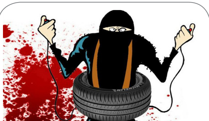
موج خون در جشن ملی نیس