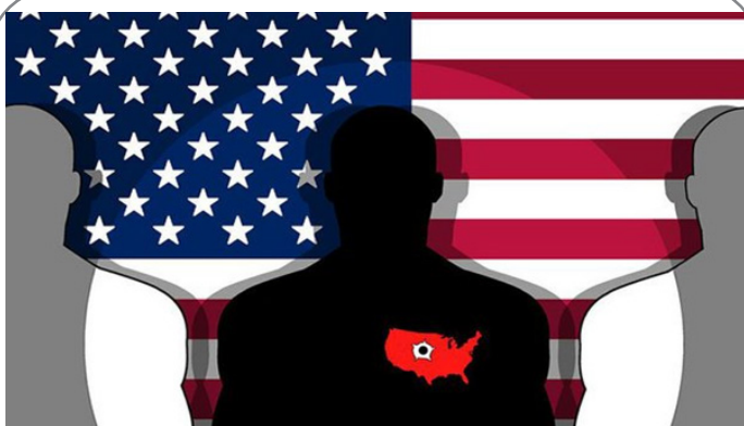
درگیری مسلحانه در آمریکا