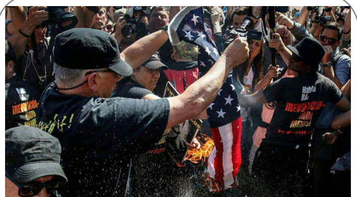
آتش زدن پرچم آمریکا در حاشیه کنوانسیون حزب جمهوری خواه در کیولند