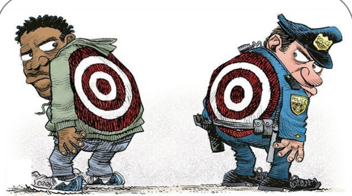
دوئل پلیس آمریکا و سیاه پوستان