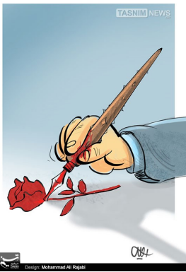
Design: Mohammad Ali Rezaei