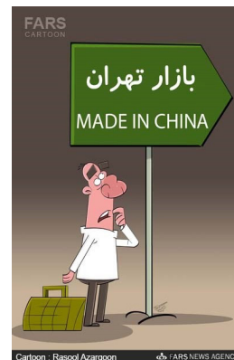
Cartoon: Rasool Azargoon FARS NEWS AGENCY