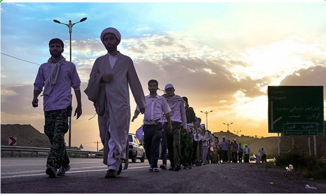
کاروان زائران پیاده میناق با ولایت