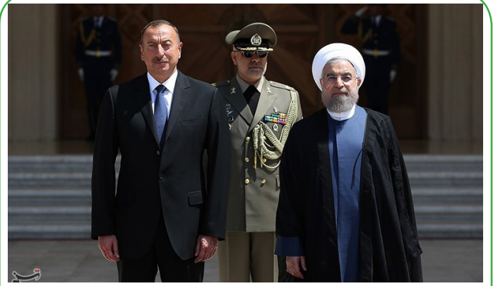
استقبال رسمی رئیس جمهوری آذربایجان از دکتر روحانی