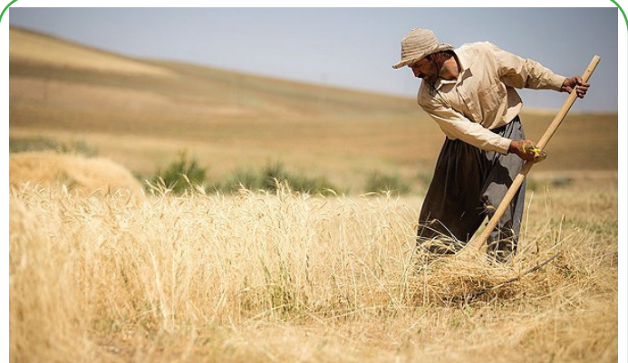
برداشت سنتی گندم دیم