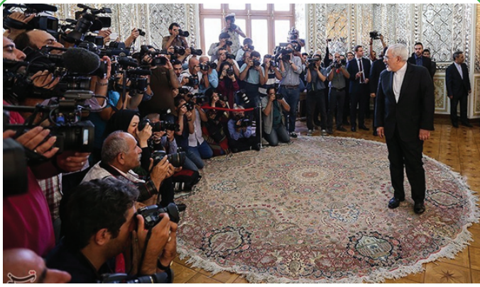
۱۷ مرداد - روز خبرنگار