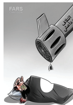
Cartoon - Farhad Bahrami FARS NEWS AGENCY