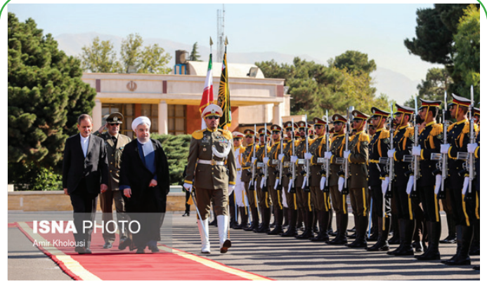
بدرقه رئیس جمهور در سفر به کشور آذربایجان