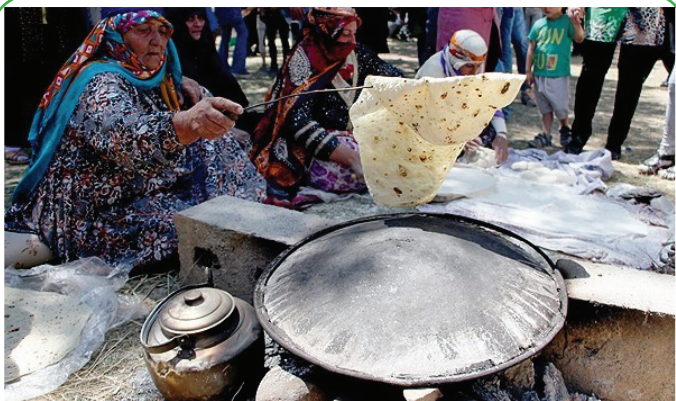
آذربایجان شرقی - اولین جشنواره فطیر و غذاهای محلی هریس