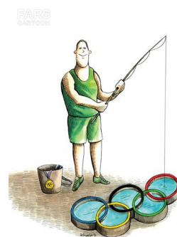
Cartoon - Khalaji FARS NEWS AGENCY