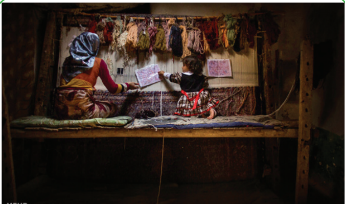
قره آغاچ کلان اردبیل - قالی بافی زنان روستا