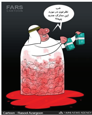
Cartoon - Rasool Azargoon FARS NEWS AGENCY