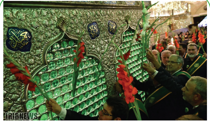
شیراز - گلباران ضریح مطهر حضرت شاهچراغ در آستانه دهه کرامت