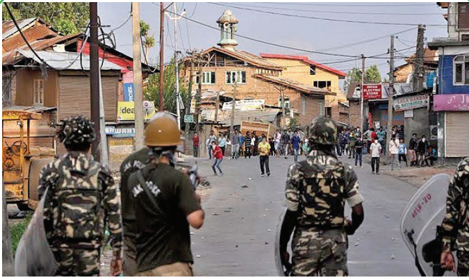
ادامه بحران کشمیر