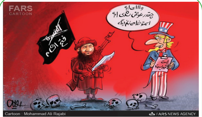
Cartoon - Mohammad Ali Rajabi