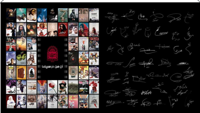
نمایشگاه پوستر فیلم فیلمسازان نسل اول در موزه سینما