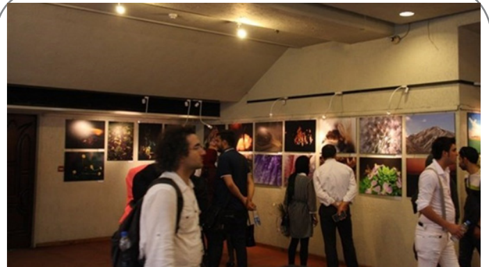
نمایشگاه عکس ردپای طبیعت در نگارخانه های برج آزادی