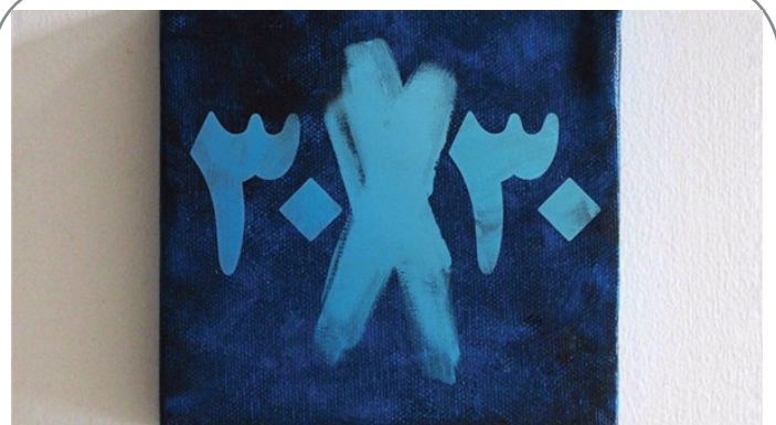
نمایشگاه «سی در سی» در باغ موزه هنر ایرانی افتتاح شد