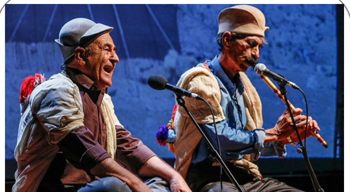
سومین فستیوال موسیقی نواحی و آیینی ایران