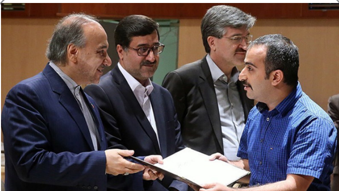
تقدیر از برگزیدگان نمایشگاه صنایع دستی