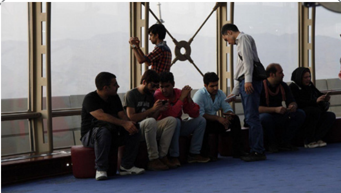
نخستین گردش فیلم‌سازی با تلفن همراه در تهران