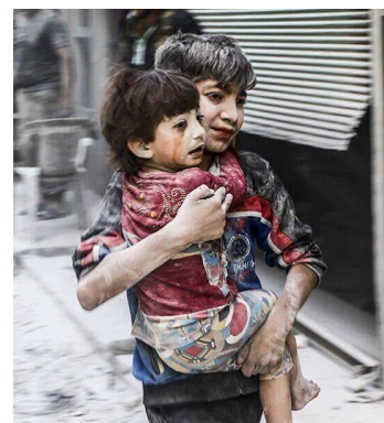
کودکان "حلب" قربانی سیاست شیطان‌آمیز آمریکا در منطقه