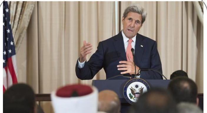
وعده جان کری برای پذیرش پناهیجویان سوری در آمریکا!