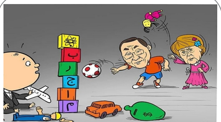
بازی غرب با برجام