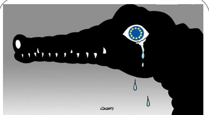
اشک تمساح اروپا برای مهاجران