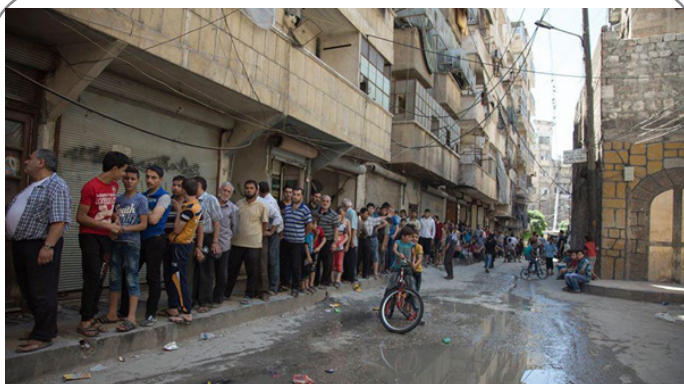
صف نان در مناطق تحت سلطه تروریستها در "حلب"