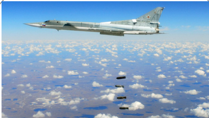
حملات هوایی روسیه علیه مواضع داعش