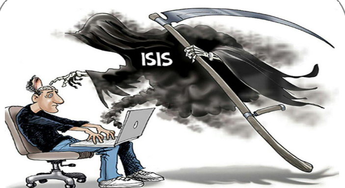
داعش در فضای مجازی