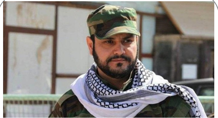
دبیرکل جنبش نجبا: سفارت آل سعود در عراق پشتیبان همه انفجارهاست