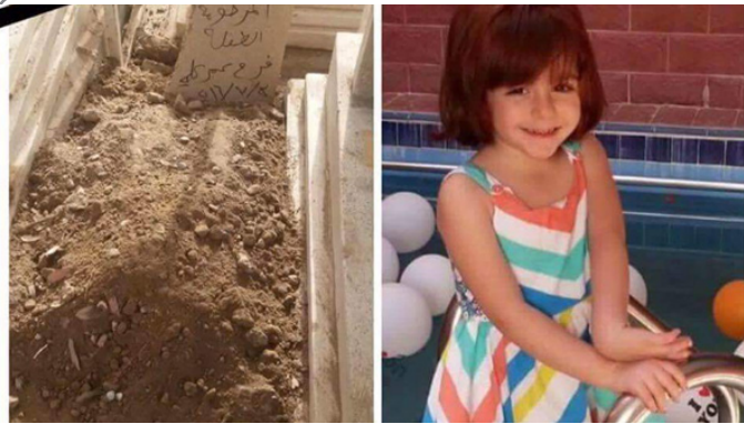
دخترک کشته شده در انفجار بازار بغداد