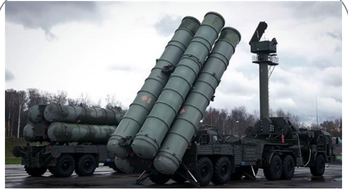
روسیه: دومین محموله سامانه اس ۳۰۰ به ایران ارسال می شود