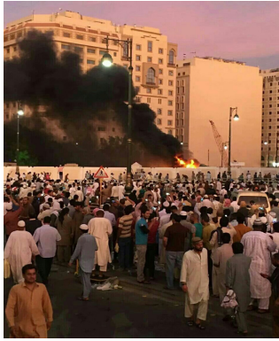
انفجار در مدینه منوره