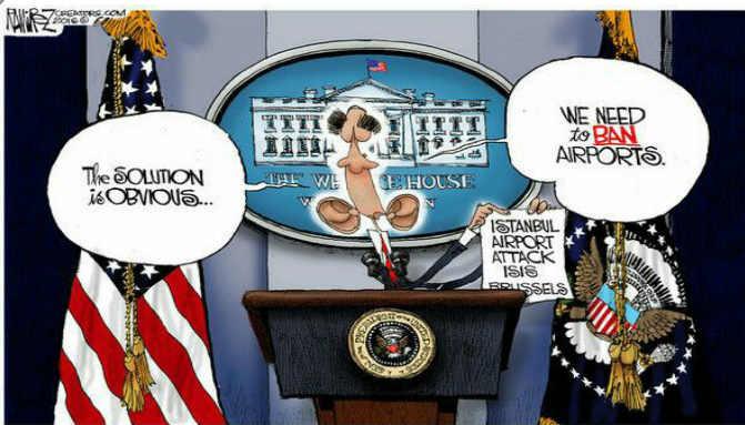
اوباما و حملات تروریستی به فرودگاه آتاتورک استانبول!