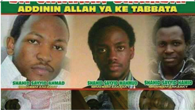
سالگرد شهادت فرزندان شیخ زکزاکی در روز قدس