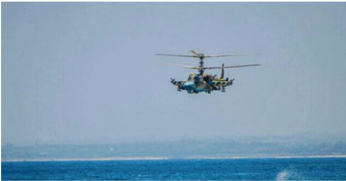
تمساح کاموف کا-۵۲ بر فراز لاذقیه