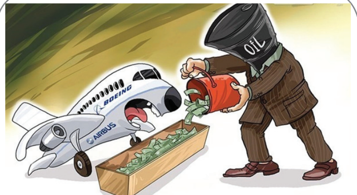
پول نفت در جیب بوئینگ و ایرباس!