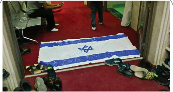
روز جهانی قدس و ورودی مسجدی در کویت