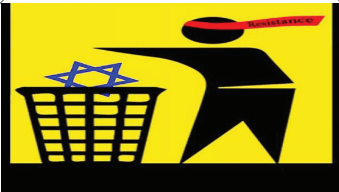
مقاومت پیروز است