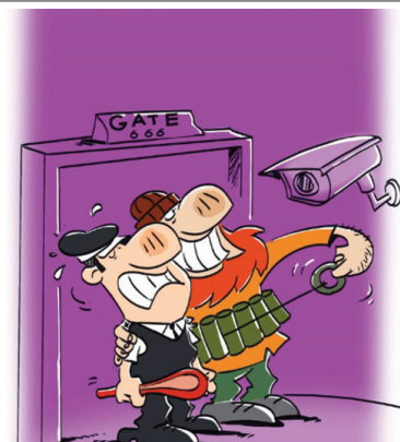
سلفی عامل انفجار فرودگاه استانبول