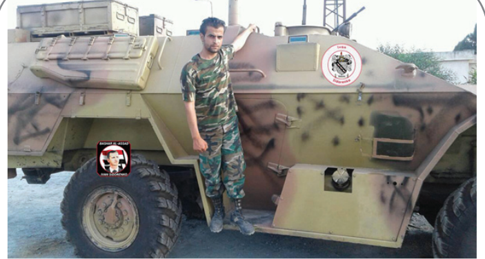
خودرو زرهی جدید روسیه در سوریه