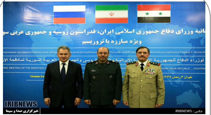
نشست سه جانبه وزرای دفاع ایران، روسیه و سوریه