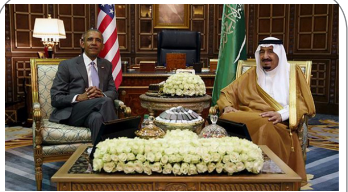
نظرسنجی: ۷۰٪ آمریکایی‌ها مخالف حمایت آمریکا از عربستان هستند