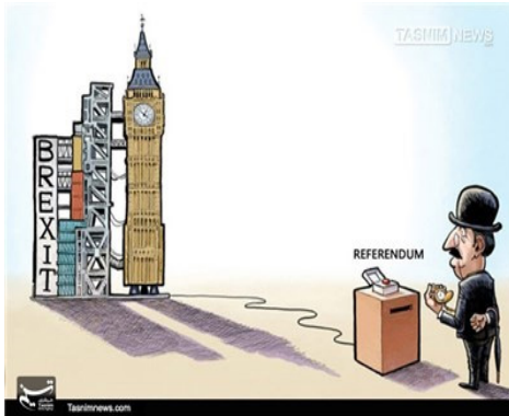
انسجام اتحادیه اروپا با خروج انگلیس