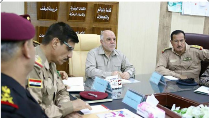
بازدید حیدر العبادی از ستاد فرماندهی عملیات آزادسازی فلوجه