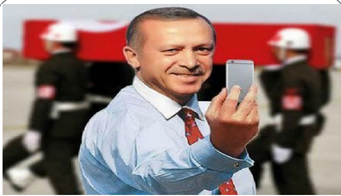
رد درخواست اردوغان از سوی خانواده محمد علی کلی برای سخنرانی در مراسم تشییع او