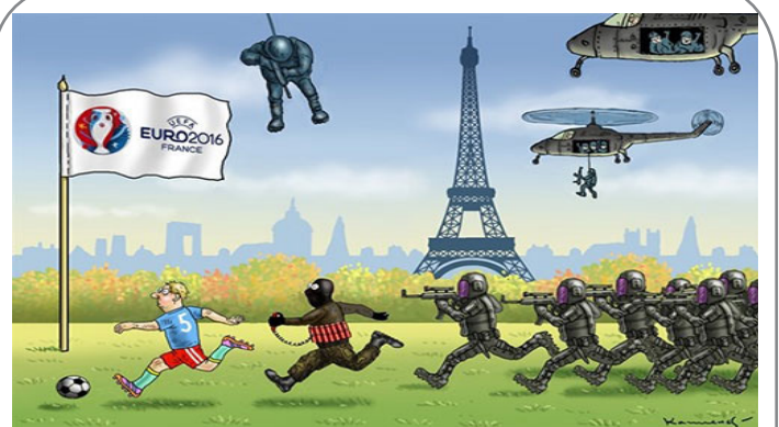
داعش در یورو ۲۰۱۶