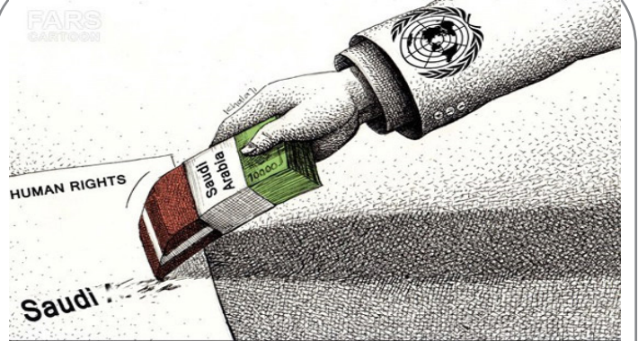
عربستان سازمان ملل را تهدید مالی کرد!