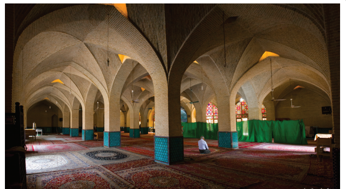
یزد - مسجد جامع کبیر