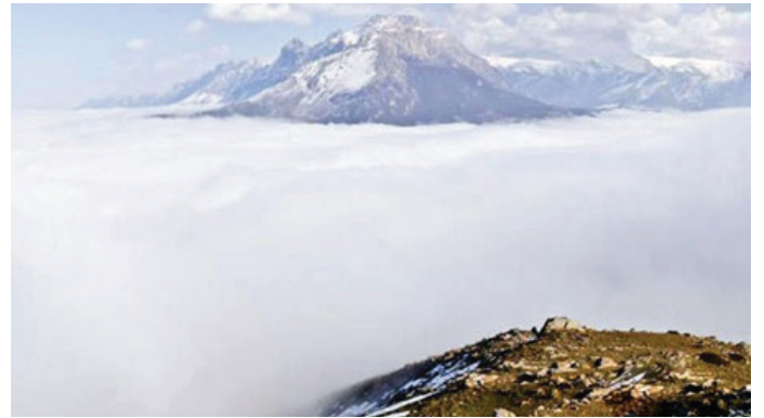
اواسط جاده فیروز کوه - منطقه خطیر کوه