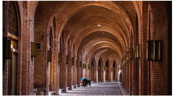
قزوین - کاروانسرای سعدالسلطنه