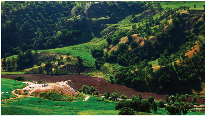
آذربایجان غربی - چشمه کانی گراوا