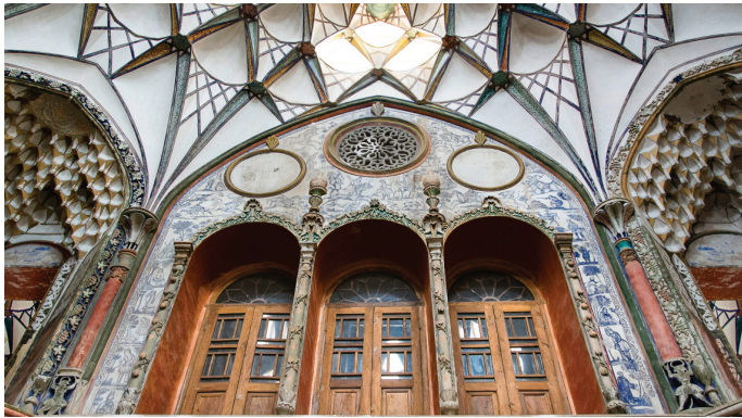
کاشان - سرای بروجردی