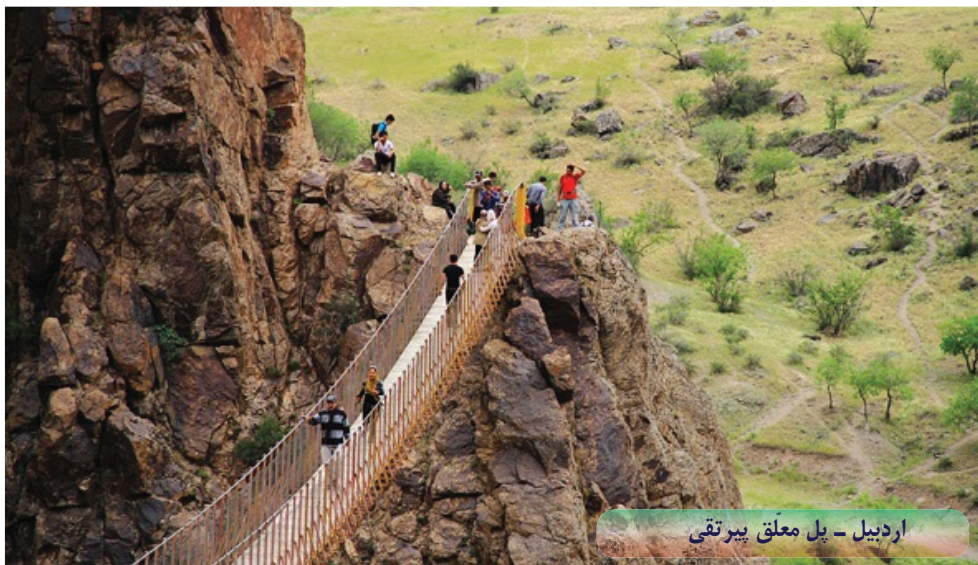
اردبیل - پل معلق بیرتقی

ایجاد شغل، به ابزاری برای ایجاد اشتغال بدل شود. امروزه از توسعه صنعت گردشگری به عنوان مهمترین عامل در کاهش مفاسد اجتماعی و رسیدن به جامعه سالم یاد می کنند و تحصیل رفاه اجتماعی و رسیدن به حداقل های زندگی قابل استناد و استاندارد شده قطعاً از طریق توسعه و رونق صنعت گردشگری میسر است.