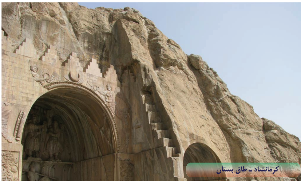
کرمانشاه - طاق بستان

هزار نفر از کشور عمان تنها برای کاشت مو به ایران سفر کرده اند؛ و بخش جراحی زیبایی ایران از جمله جراحی زیبایی بینی، لفتینگ صورت، کاشت مو بخشهایی است که بسیار از گردشگران سلامت کشورهای اروپایی را به ایران سرازیر کرده است. تمامی این موارد به دلیل دانش فنی و اطمینانی هست که در بین کشورهای همسایه و دیگر کشورها رواج پیدا کرده است و دومین دلیل عمده کاهش نرخ پول ملی در مقابل ارزهای معتبر دنیا از جمله دلار و یور می باشد.