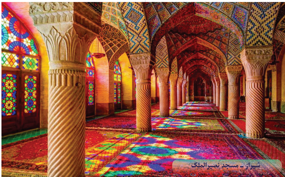
شیراز - مسجد نصیرالملک

کشور ایران با همه جاذبه های بزرگ و جهانگردی که در اختیار دارد، می تواند در نهایت سهولت از این همه امکانات و آثار ارزشمند استفاده های تبلیغاتی بسیار وسیعی بنماید.