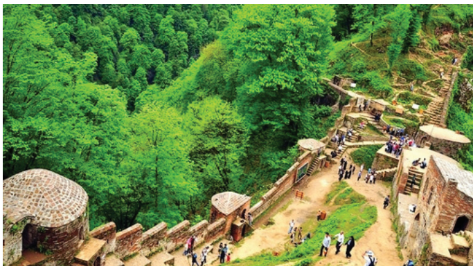
گیلان - شهر ماسوله