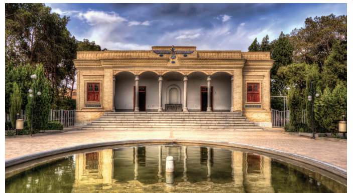
یزد - آتشکده زرتشتیان