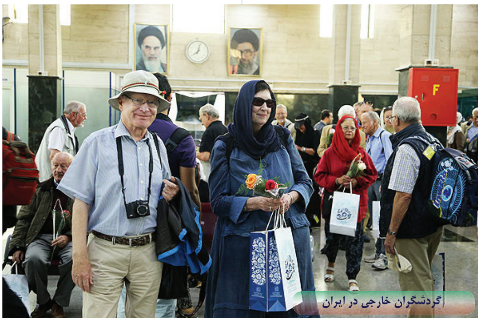
گردشگران خارجی در ایران

برنامه ریزان بخش صنعت گردشگری بر این باورند که خوشبختانه همه نقاط ایران ظرفیتهایی برای صورت های مختلف گردشگری از جمله: گردشگری فرهنگی، زیارتی، ورزشی، اکوتوریستی، ماجراجویانه، تفریحی و ... دارند، بنابراین کشورمان این ظرفیت را دارد تا اشتغال را در سراسر ایران گسترش دهد. به علاوه، توسعه گردشگری نیازمند مشارکت فعالانه بخش