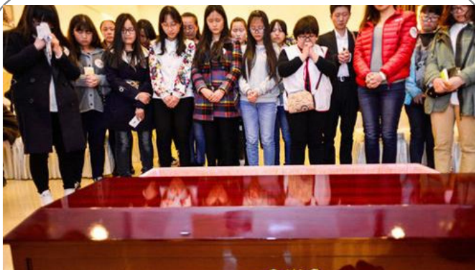
سرگرمی جدید در چین - صف کشیدن برای خوابیدن در تابوت و تجربه مرگ ساختگی!