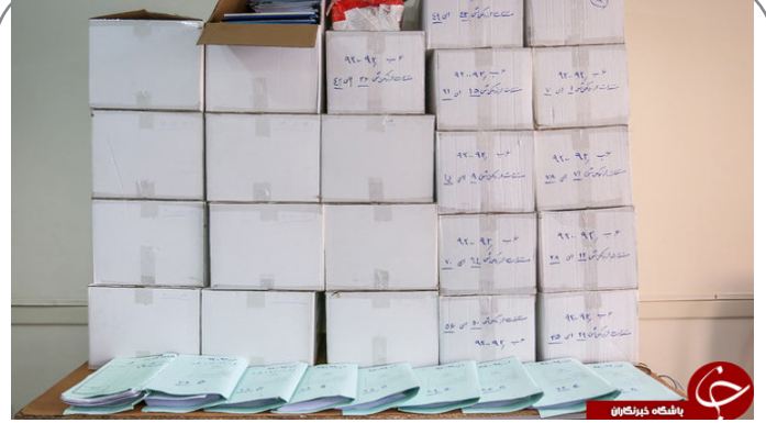
پرونده های بابک زنجانی