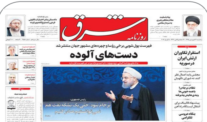
گاف روزنامه شرق که آن را غیر عمدی دانسته است!