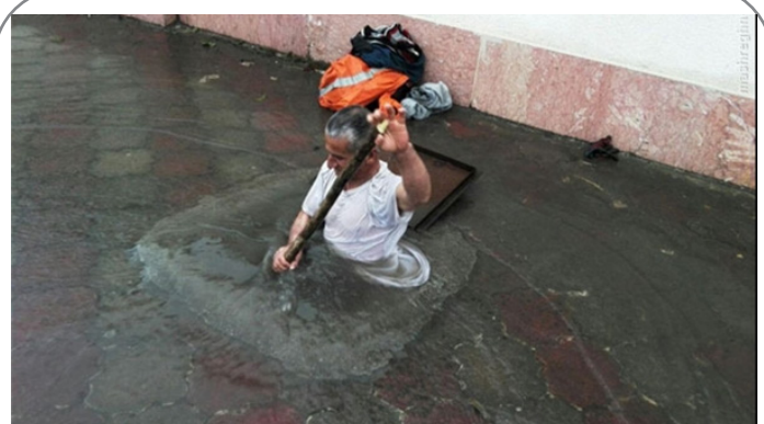
از خودگذشتگی کارگر شهرداری برای رفع آبگرفتگی!