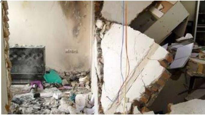
آذربایجان شرقی/خداآفرین - اصابت گلوله توپ ارتش ارمنستان به یک خانه