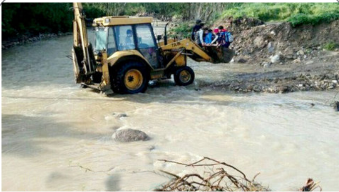
سیل در مازندران - جابجایی دانش آموزان با بیل مکانیکی!