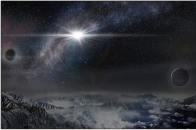
ناسا - بزرگترین انفجار ثبت شده عالم در فاصله سه میلیارد سال نوری با زمین!