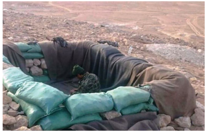
نمازخانه مدافعان حرم در خط مقدم