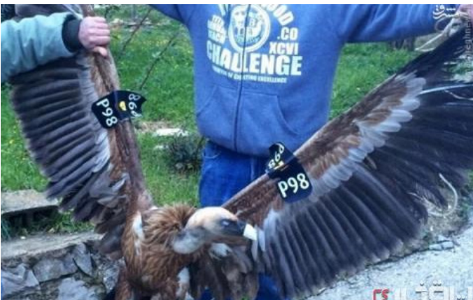
صید کرکس جاسوس در لبنان!