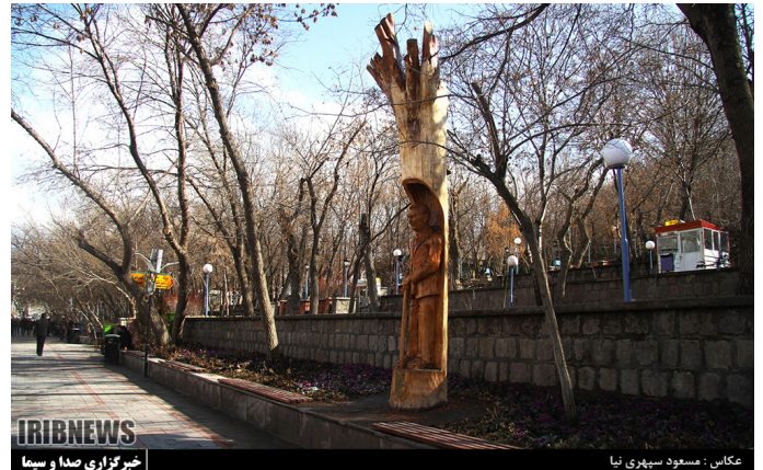
پیکر تراشی درختان پارک ائل گلی