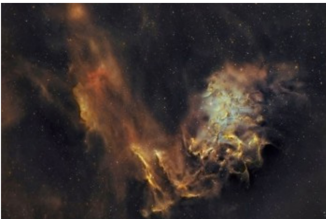
تصویر ناسا از صورت فلکی « ارابه ران »