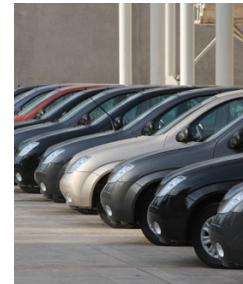
در گفتگو با فردا:

«حجت الاسلام ابراهیم کلانتری، رئیس نهاد نمایندگی مقام معظم رهبری: همه افراد در هر انتخاباتی که در جمهوری اسلامی برگزار می‌شود باید تابع قانون باشند به این دلیل که قانون فصل الخطاب است. اگر قرار باشد هر فردی نظر خود و جناح خود را مطرح کند، جز هرج و مرج و بی‌قانونی نتیجه دیگری ندارد. در حقیقت شورای نگهبان، نگهبان اسلامیت و جمهوریت نظام است. بهتر است دولت براساس قانون و در چارچوب وظایف تعیین شده‌اش عمل کند و نهادهای دیگر نیز بر همین اساس عمل کنند. چرا که در این شرایط نه گرفتار هرج و مرج می‌شویم و نه اینکه دستگاه‌ها اولویت کاری خود را فراموش می‌کنند. اگر قرار باشد دولت اولویت اصلی خود که اقتصاد است را رها کند و به موضوع مجلس تمرکز کند، قطعاً آن نتیجه‌ای که از صندوق‌های بیرون می‌آید نمی‌تواند مجلس باشد که گره‌ای از مشکلات ملت را باز کند.