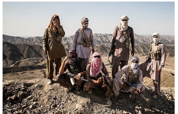
رنجرهای مرزی ورزیده برای حفاظت از مرزهای شرقی ایران