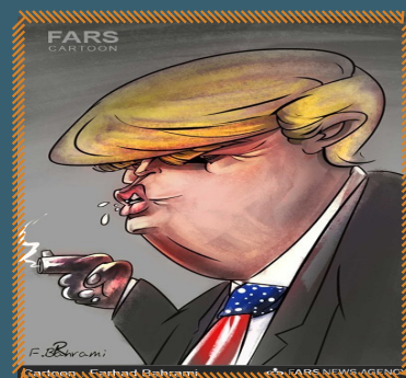
هفت تیرکش غرب در راه است!