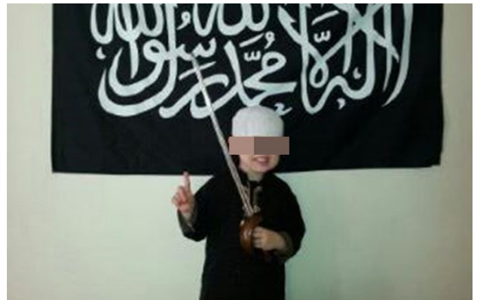
کودک انگلیسی که داعشی شد!