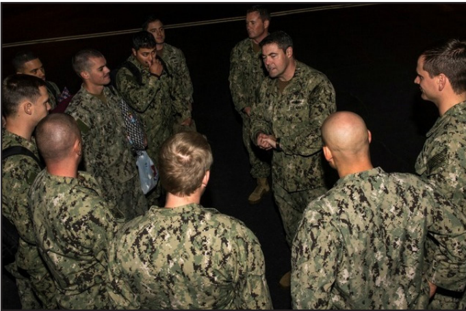
بازگشت ملوانان بازداشت شده آمریکایی