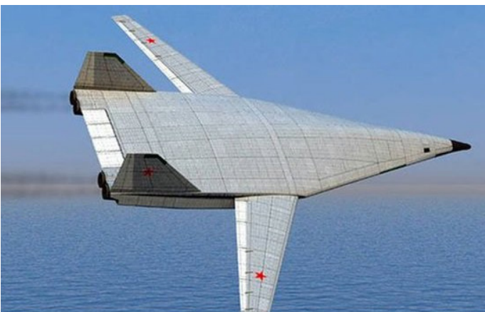
طرح مفهومی بمب افکن جدید روسیه با قابلیت حمل سلاح هسته ای