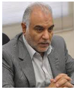
در گفتگو با فارس:

اول بهمن ماه، رئیس جمهور در جمع استانداران و فرمانداران سراسر کشور گفت: قانون اساسی ما می گوید دولت و وزارت کشور مجری انتخابات و شورای نگهبان ناظر بر آن است، خیلی باید دقت شود تا مرزها مخلوط نشوند، امروز بهترین راه همچنان گفتگو و رایزنی و مذاکره و مشورت است و من از وزیر کشور و وزیر اطلاعات و معاون اول خود خواسته ام که به رایزنی های خود با شورای نگهبان ادامه دهند. فراکسیون روحانیت مجلس در نامه ای به رئیس جمهور نوشت: سخنان شما در جمع فرمانداران موجب تأسف و تأثر شد و این طور القامی کند که دولت برای فرار از پاسخگویی درباره مشکلات اقتصادی اقدام به جنجال آفرینی می کند.