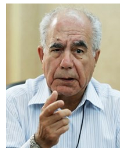
در گفتگو نسیم آنلاین:

«حسن پلارک، رئیس ستاد بازسازی عتبات عالیات: قرار است گنبد امام حسین (ع) ۷ متر مرتفع شود و هم اکنون این گنبد در کرمان ساخته شده است. ما هر خشت طلایی این گنبد را با قیمت ۲ میلیون و ۱۵۰ هزار تومان به مردم می فروشیم. به این ترتیب که مردم می توانند به دفتر ستاد بازسازی عتبات عالیات استان خود مراجعه کنند و فیش واریزی خود را به آنها ارائه کنند، پس از یک هفته سند و شماره آن خشت به همراه لوح افتخار برای آن فرد ارسال می شود. پس از آن، خشت خریداری شده روی گنبد جدید نصب می شود. این گنبد ۳۳ هزار خشت دارد. امیدواریم تا پایان سال ۹۵ این گنبد نصب شود. ما دنبال این هستیم که شرایط اهدای نذورات مردم را تسهیل کنیم ما بیشترین دریافتی هایمان از طریق پیامک تلفنی بوده است. اما باید درباره مقدار کمک های مردم اطلاع رسانی کنیم تا کاسب کارانه بودن این کار از بین برود.