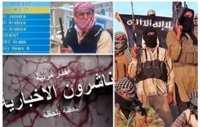
تصاویر ادعایی درباره راه اندازی شبکه ماهواره ای داعش