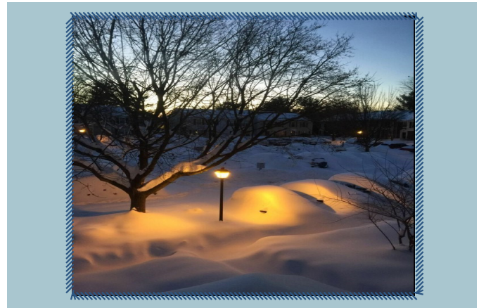
بارش برف شدید در آمریکا