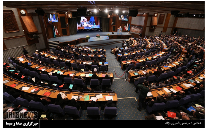
نشست مدیران رسانه ملی