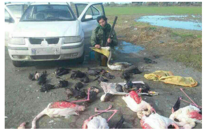
بازداشت عامل شکار پرندگان در استان گلستان