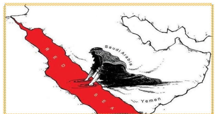
دریای سرخ رنگ خون گرفته است!