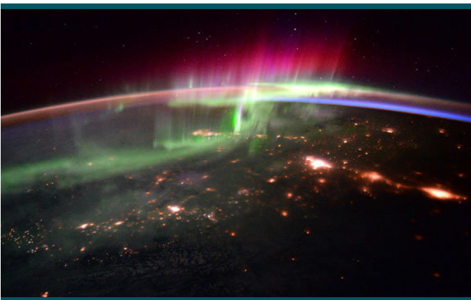
جدیدترین عکس از شفق قطبی