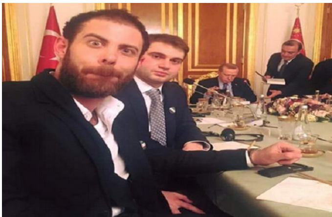
سلفی جنجالی فعال سیاسی سوری با رجب طیب اردوغان!