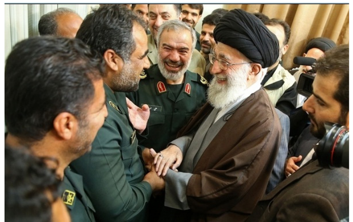
پاسداران بازداشت کننده ملوانان آمریکایی در محضر رهبر معظم انقلاب