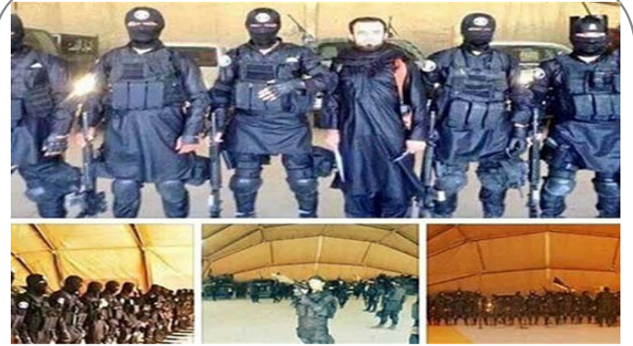
تصویر منتشر شده از یگان ویژه داعش!