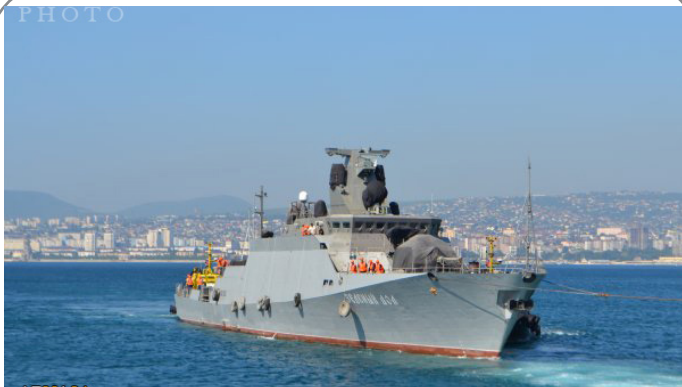
ورود موشک اندازهای روسی به بندر طرطوس سوریه