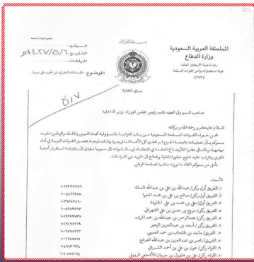
اعتراض ده فرمانده ارشد سعودی درباره تصمیم به مداخله نظامی در سوریه