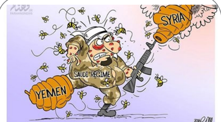
تاوان حماقت سعودی!