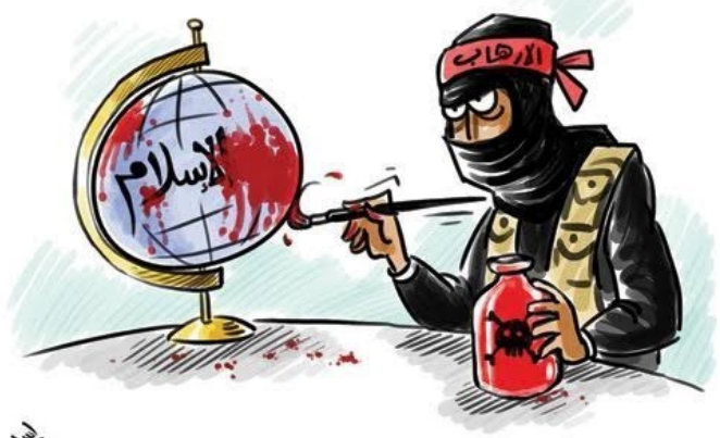
کاریکاتور - تخریب چهره اسلام