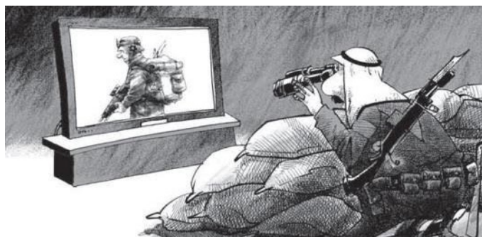
کاریکاتور - ائتلاف مضحک سعودی