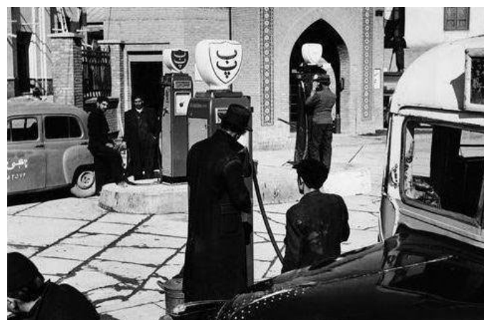
پمپ بنزینی در تهران شصت سال قبل