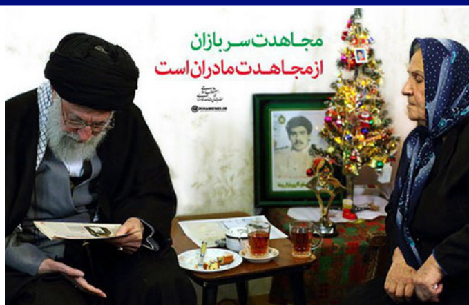
حضور مقام معظم رهبری در منزل یک شهید مسیحی