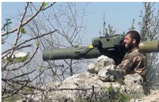
داعش مجهز به سلاح آمریکایی