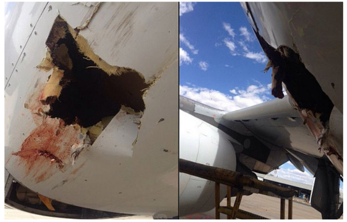
نامیبیا - پرنده ای که هواپیما را سوراخ کرد!