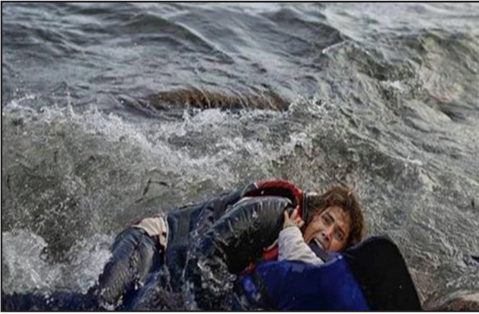
مادر سوری که نگذاشت مدیترانه فرزندش را غرق کند