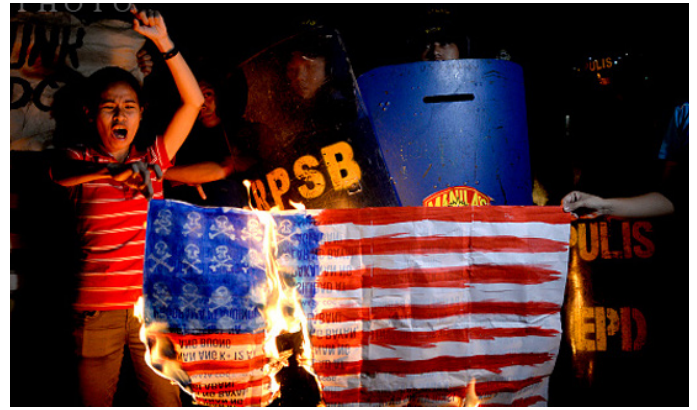
دانشجویان فیلیپینی پرچم آمریکا را آتش زدند