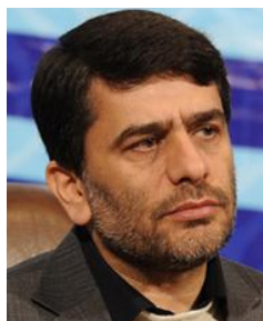
در گفتگو با افکار خبر:

آیت‌الله جنتی دبیر شورای نگهبان: تمام تلاش ما بر برگزاری انتخاباتی سالم، آزاد، قانونی، رقابتی و در کمال امنیت متمرکز است و برای تحقق این هدف، شورای نگهبان در کلیه مراحل از جمله بررسی صلاحیتها با دقت نظارت و اقدام خواهد کرد و تحت تأثیر فشارها و فضا سازیها قرار نخواهد گرفت.