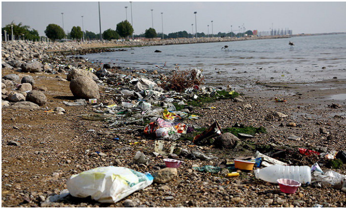
آلودگی در ساحل بندرعباس