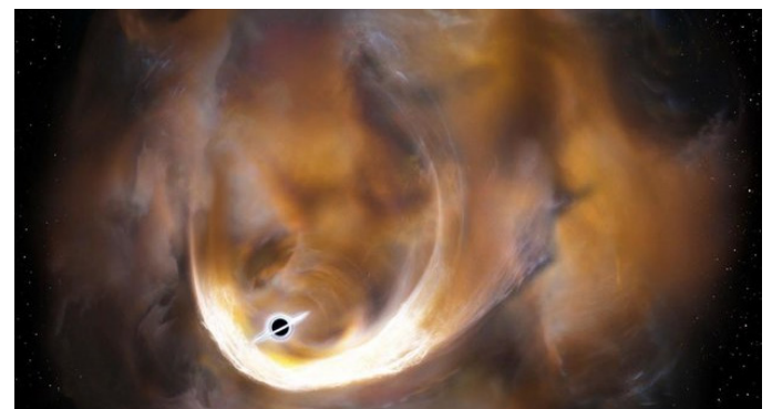
کشف توده گازی مرموز در کهکشان راه شیری