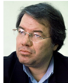
در گفتگو با فرارو:

«رضا شیوا، رئیس شورای رقابت: در جلسه این هفته شورای رقابت وضعیت بازار خودرو مورد بررسی قرار خواهد گرفت، قرار است در این جلسه دستورالعمل قیمت‌گذاری هم توسط اعضای جدید شورای رقابت مورد ارزیابی قرار گیرد. انحصار زمانی در بازار خودرو وجود ندارد که بازیگران متعددی در سطح بازار به فعالیت بپردازند، به اعتقاد من امروز وضعیت انحصاری بازار خودرو تغییری نسبت به سال گذشته نکرده است اما قرار شده تا این موضوع با حضور اعضای جدید شورای رقابت بررسی شود. در حال حاضر بازار خودرو متعادل و واسطه‌ها حذف شده‌اند اما هنوز در بخش فروش با مشکلاتی همراه هستیم. امیدوارم با لغو تحریم‌های بین المللی شرکت‌های خودروساز بتوانند در قالب همکاری با شرکت‌های بین المللی از تکنولوژی روز استفاده و محصولات متنوع و باکیفیتی را راهی بازار کنند.