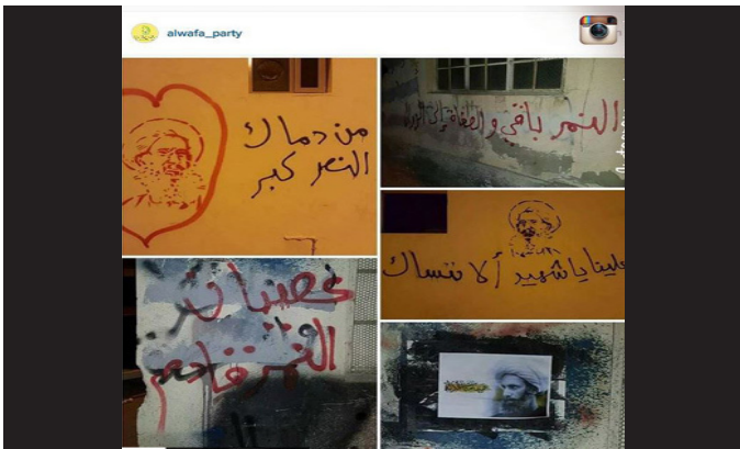
دیوارنویسی ها در یمن برای شهید شیخ نمر