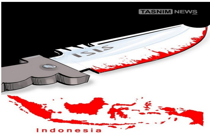
داعش در اندونزی!