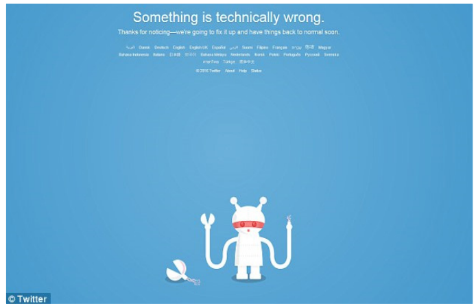
توییت مدت زمان کوتاهی به کما رفت!