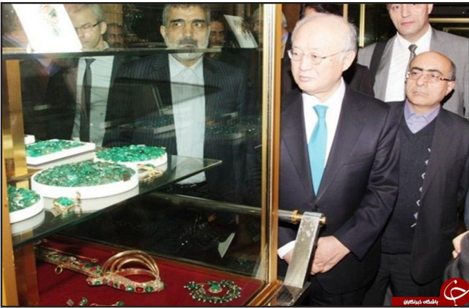
دیدار آمانو از خزانه جواهرات ملی ایران