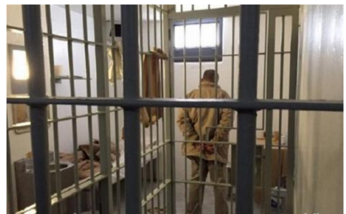
بزرگترین قاچاقچی جهان در یک زندان فوق امنیتی درمکزیک