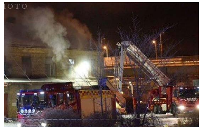
مسجدی در سوئد طعمه حریق شد