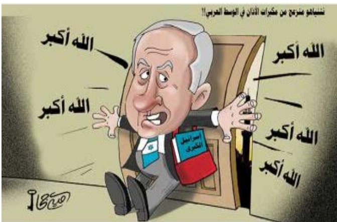
تنتباهو چندی پیش از تعطیل کردن مساجد در فلسطین سخن گفته بود!