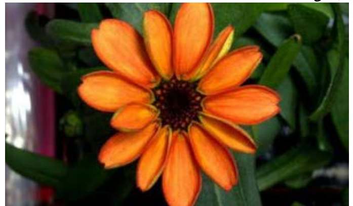
شکفتن نخستین گل در آزمایشگاه ایستگاه فضایی بین المللی