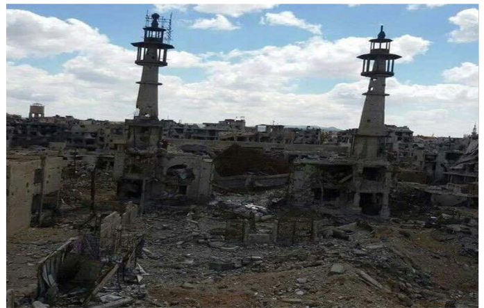
تصویر جدید از حرم حضرت سکینه(س) در جنوب غربی دمشق که تابستان سال گذشته ویران شده بود