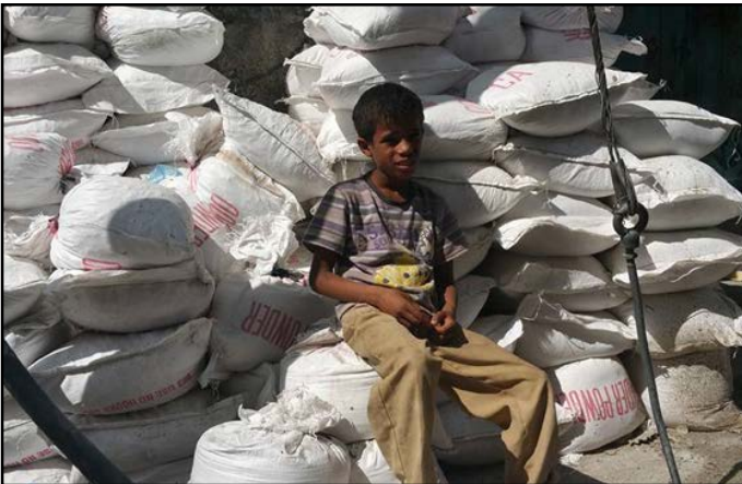
کودک یمنی که «سنگر» می فروشد!