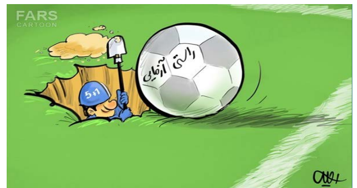
توپ راستی آزمایی در زمین غرب!