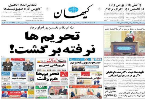
تیترا جالب کیهان!