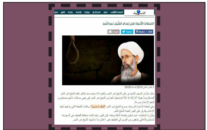
روزنامه الدیار لبنان: شیخ نمر پیش از اعدام دو رکعت نماز خواند و با فریاد «لیک یا حسین» به استقبال شهادت رفت.