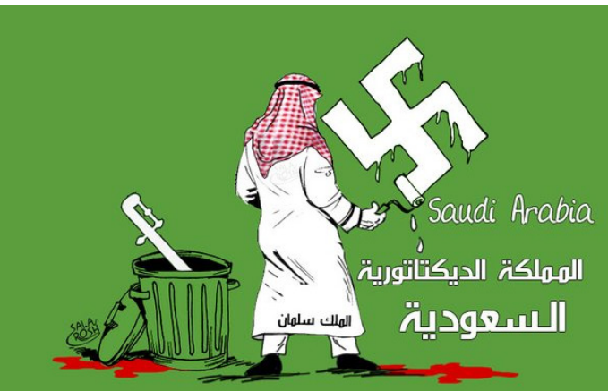
نظام دیکتاتوری عربستان سعودی!