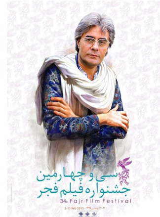
پوستر متفاوت جشنواره فیلم فجر