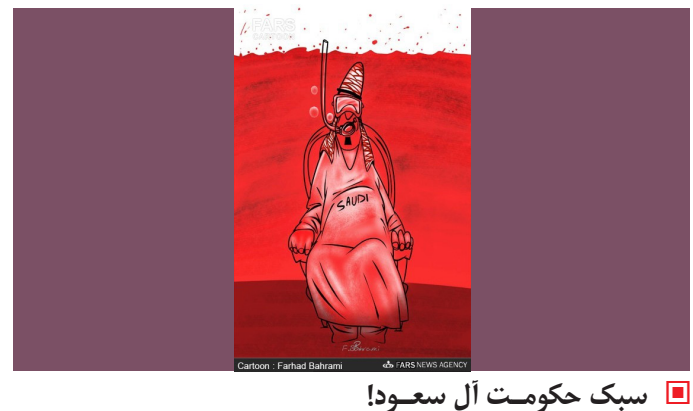
سبک حکومت آل سعود!