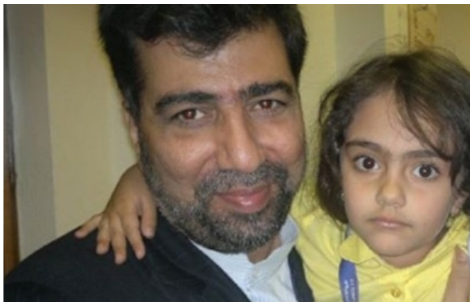
دختر شهید رضایی نژاد در آغوش شهید رکن آبادی