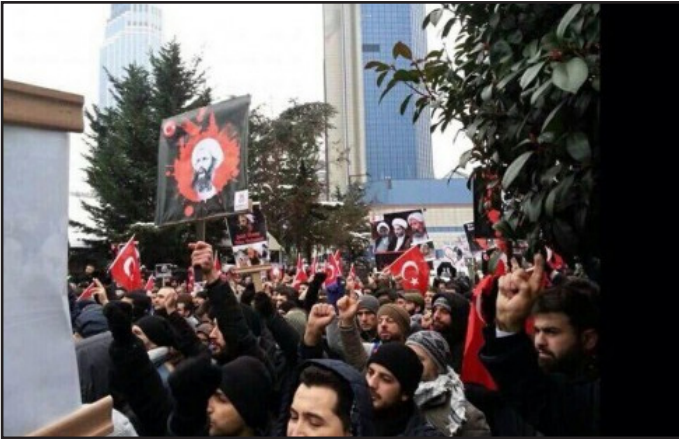
تظاهرات شیعیان ترکیه مقابل سفارت عربستان